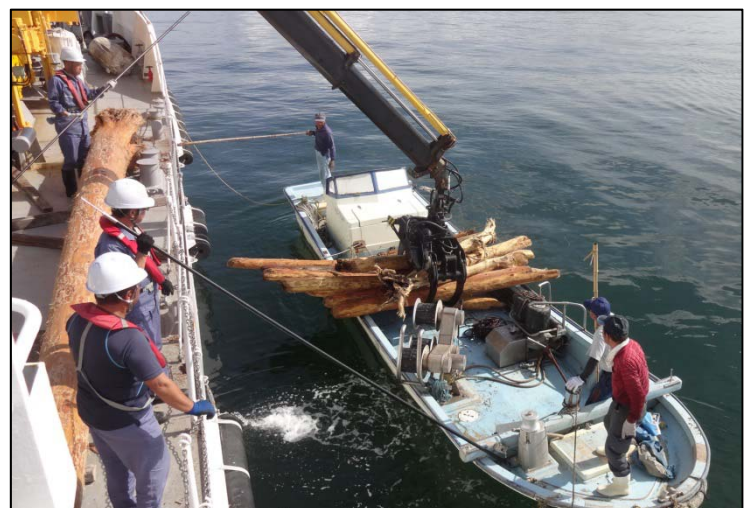
漁業者と連携した流木回収