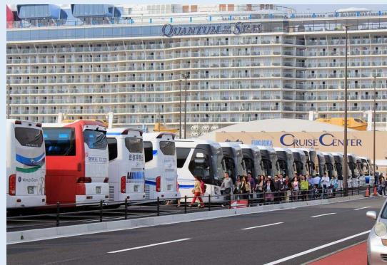
バスに乗りし観光に向かう乗船客の様子