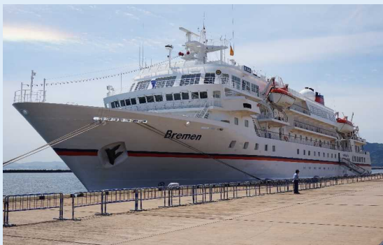
ブレーメン（別府港）

別府港では初寄港にあたり、船長や別府市関係者が出席して歓迎式典が行われ、船長らに記念品の竹細工や花束が贈呈されました。クルーズ乗船客約150人は、ドイツやフランス、オランダなど欧州からの旅行者が多く、別府市の地獄めぐりや臼杵市の石仏などを観光しました。