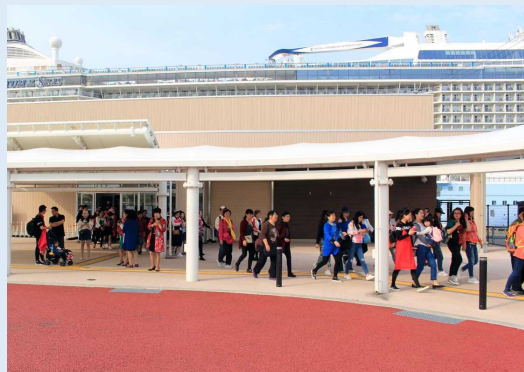
クルーズセンターから観光に向かう乗船客の様子