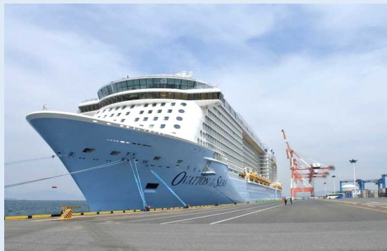
オペーション・オブ・ザ・シーズ(北九州港)

クルーズ乗船客約4,600人は、バス112台に分乗し、北九州市内の小倉城や門司港レトロ地区、響灘緑地（グリーンパーク）などを観光しました。