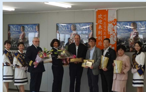
「ブレーメン」の初寄港を記念した歓迎式典 （写真 中央：船長 中央右：別府市猪又副市長）