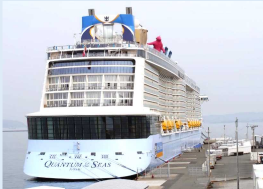
クァンタム・オブ・ザ・シーズ（博多港）

クルーズ乗船客約4,700人は、バス約110台に分乗後、太宰府天満宮や福岡タワー、福岡城跡などを観光し、免税店での買い物を楽しみました。