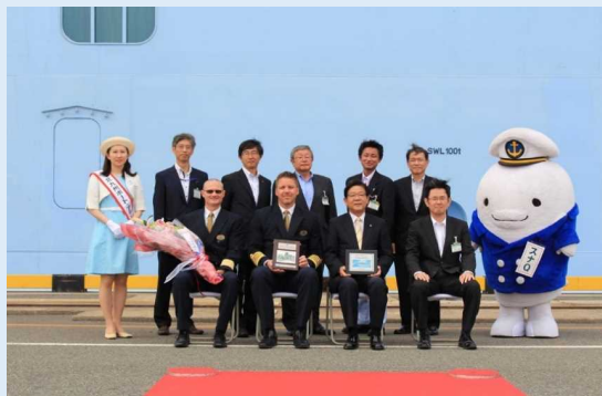
「オペーション・オブ・ザ・シーズ」の初寄港を記念した歓迎セレモニー (写真前列中央 左:船長、右:北九州市北橋市長)