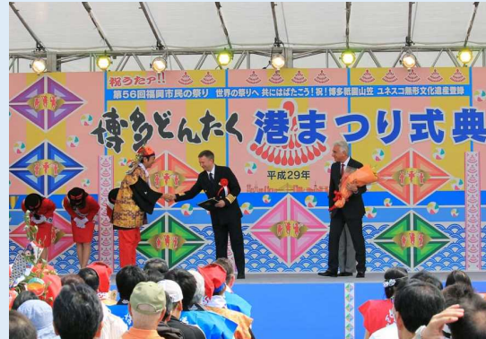
博多どんたく港まつり式典 （写真右から RCI副社長、船長、高島福岡市長）