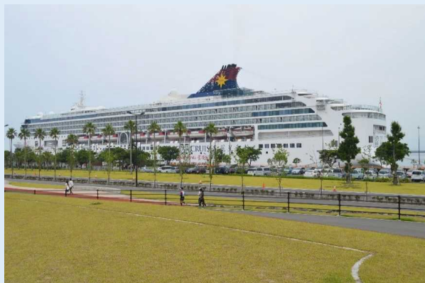
スーパースター・ヴァーゴ(鹿児島港)

日本人が船内で快適に過ごせるように日本語の船内新聞やメニュー、案内表示をはじめ、日本食の提供など各種サービスが用意されており、日本語スタッフが船旅をサポートしてくれます。ツアー日程は、現役世代でも利用しやすい週末に発着しており、日本人向けのプランとなっています。