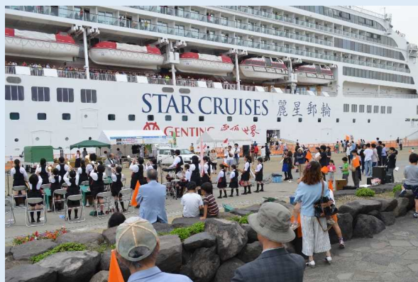
地元小学生の演奏による歓迎の様子(鹿児島港)