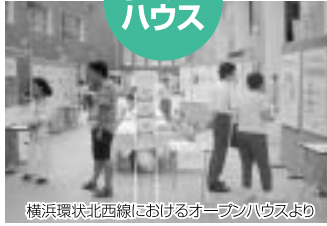
横浜環状北西線におけるオープンハウスより

PIレポートの内容についての展示や説明を行って、ご意見をお伺いするイベントです。