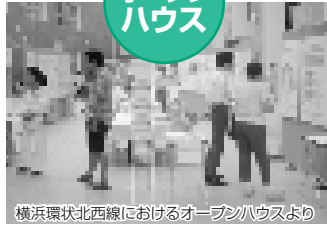
横浜環状北西線におけるオープンハウスより

PIレポートの内容についての展示や説明を行って、ご意見をお伺いするイベントです。