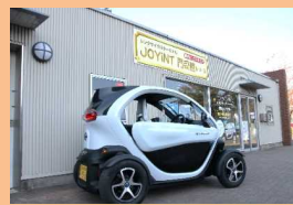
▲超小型モビリティ(2人乗り)

ここでレンタルした自転車等を利用して「みなとオアシス門司港」登録施設や、マリゲート門司からの渡船を利用して下関へも回遊することができます。受付ではおすすめのコースがのったレンタサイクルマップをもらうことができます！また、3月以降ではJR門司港駅前でも土日祝日限定で受け付けが再開します。