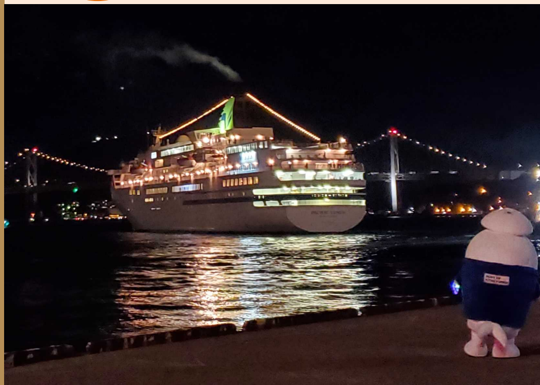
▲門司港を出航するばしふいっぴいなす

▽ニュース(NEWS) グリーンスローモビリティ出発式が開催 スロージョギングが開催されました!