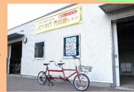
▲二人乗りタンデム自転車