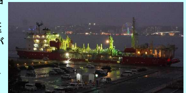
▲浚渫船「海翔丸」ライトアップ

夜にはイルミネーションと共にマルシェや音楽も楽しめるカルチャーイベントも行われました。