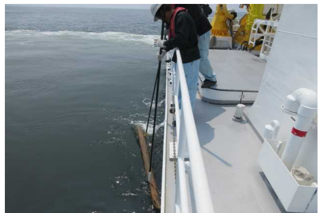
7/21 流木の回収(多比良港沖)