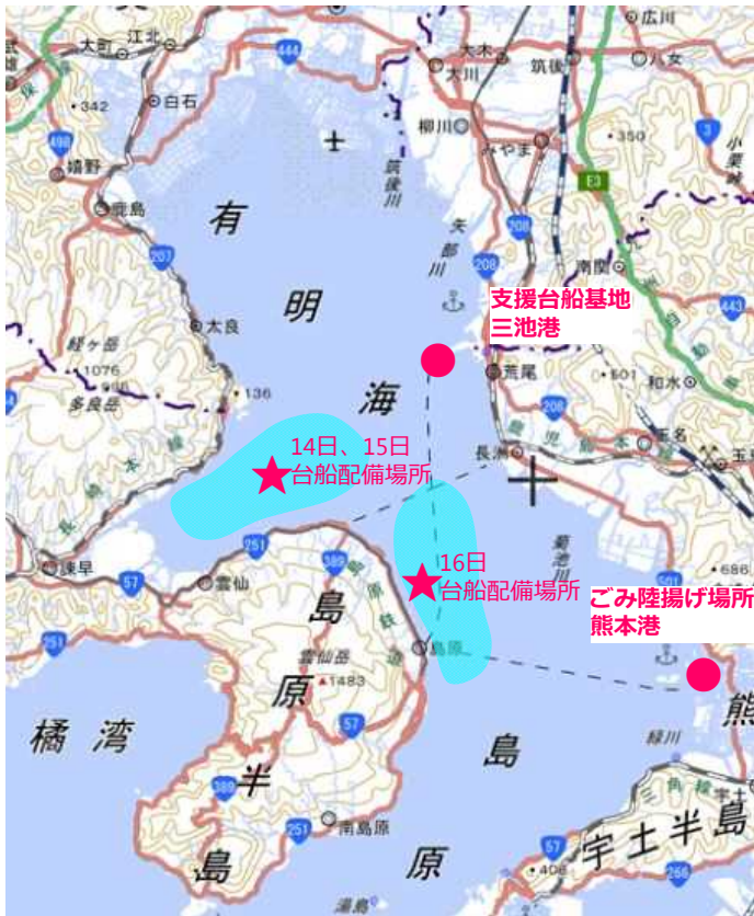
■ 漂流ごみ回収海域