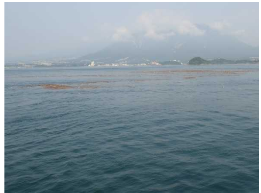
[7月16日 島原沖漂流ごみの状況]