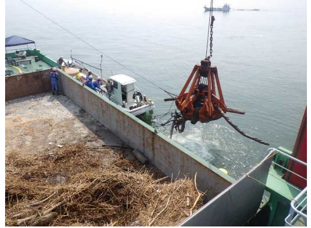
[7月15日 漁業者からの受け渡し]