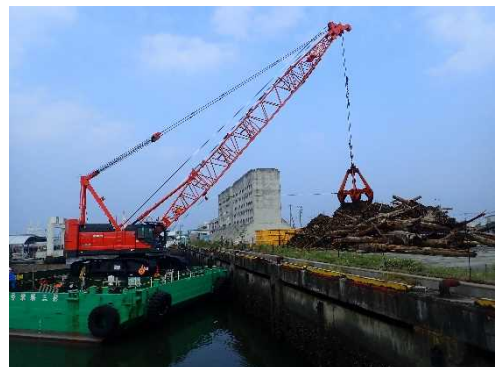
[7月17日 台船からの陸揚げ]