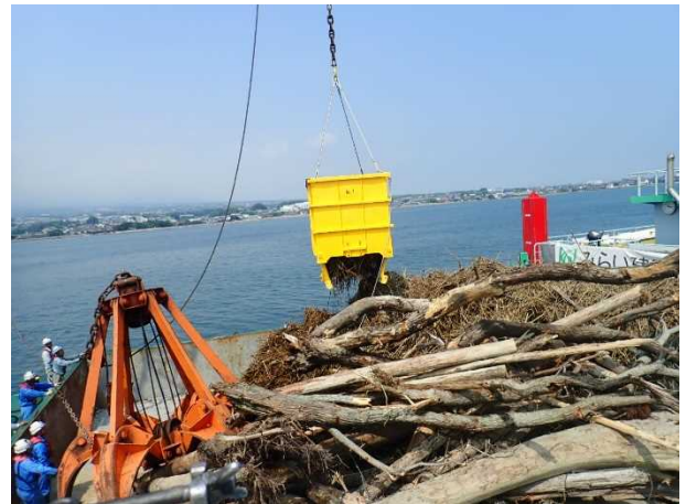
[7月16日 台船への積載状況]