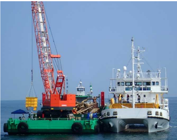
[7月15日 海煌から支援台船へのごみ揚げ]