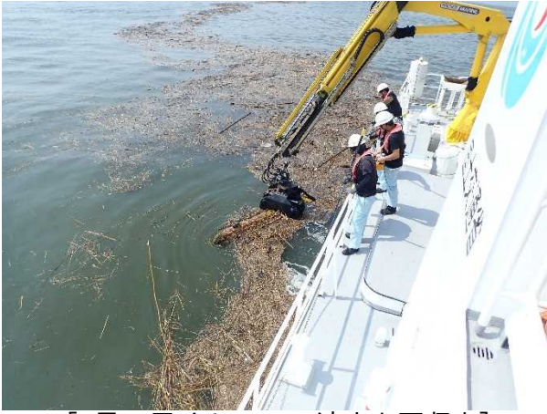
[7月14日 クレーンで流木を回収中]