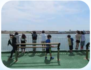
展望デッキからは みなとのようなすが 一望できます!