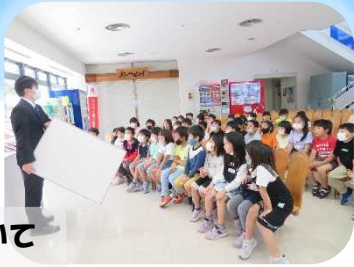
みなとについて お話しします！