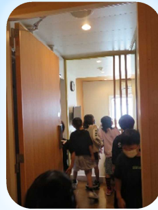
こっちは 広々した 個室だね