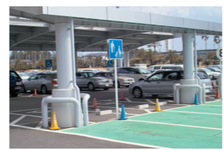
高齢者・乳幼児連れ家族用駐車帯の設置(全国初)