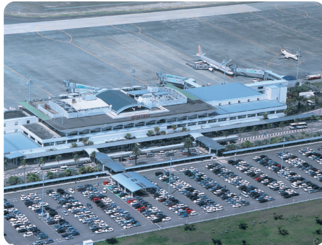
駐車場から空港ビルまでの連絡ルートにルーフを設置(バリアフリー)