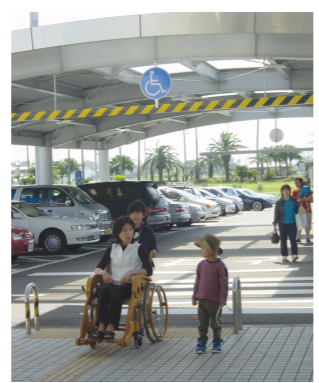
歩道部のバリアフリー化