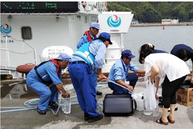
一般市民の方々への水の提供