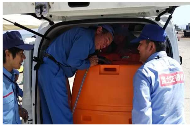
貯水タンクへの給水