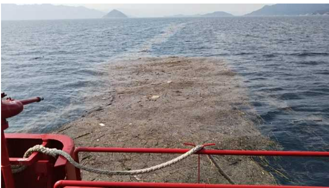
広島湾・安芸灘海域に漂流する漂流物