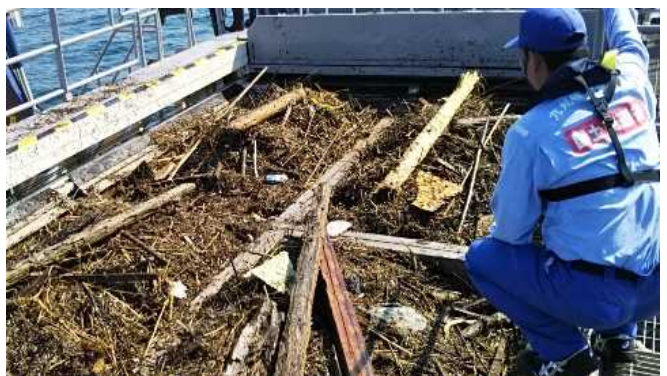
回収した漂流物で満載となったコンテナ