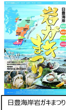
日豊海岸岩ガキまつり