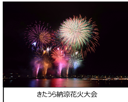
きたうらら納涼花火大会