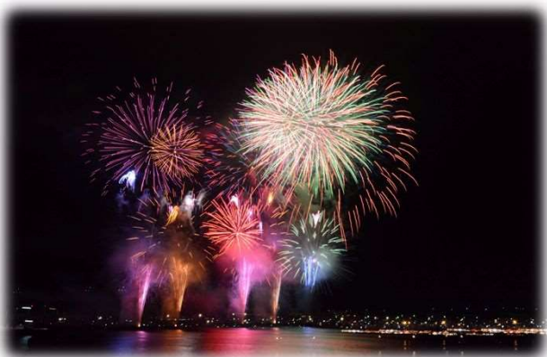
きたうら納涼花火大会