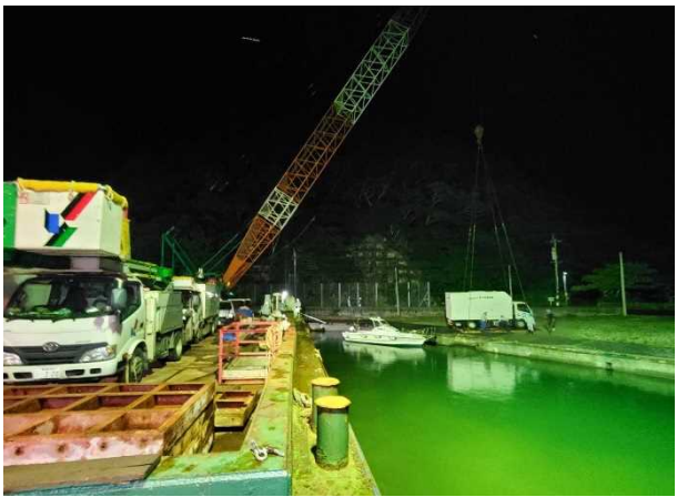
花天漁港における車両の積下ろし状況 (6月22日)