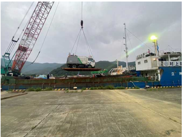
篠川港における車両の積込状況 (6月22日)