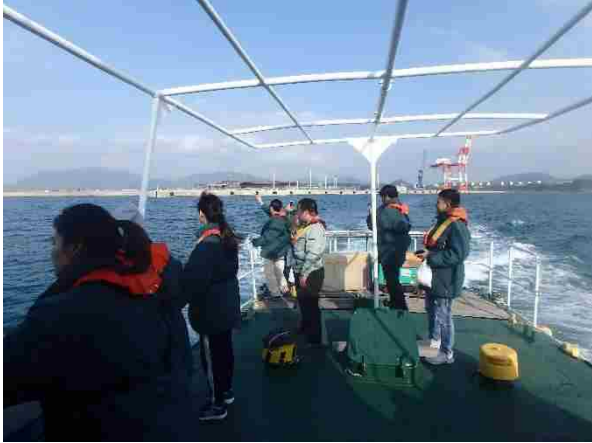
【平成30年11月30日 梅光学院大学乗船時の様子】

クルーズ船で下関を訪れる旅客はほとんどが外国籍のため、下関市内にある大学(下関市立大学・梅光学院大学)に在籍している留学生(計37名)を対象に、水上交通の乗船体験をして頂き、日本人にはない視点からの意見をお聞きしました。乗船された方に感想を聞いてみると「関門を通過したのは初めて」「また乗ってみたい」「下関～北九州間のルートも乗ってみたい」など様々でした。留学生のみなさま、ご協力ありがとうございました。