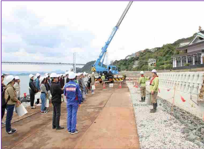
【下関港海岸の工事現場で説明を受ける学生】

学生からは、「干満差が激しい中で工事をするのは大変だと思った。」「社会の基盤をつくっていけるような事業に携われたらたらないなと思う。」など感想が述べられ、学生にとって良い機会になったと思います。