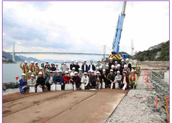
【下関港海岸で記念撮影】