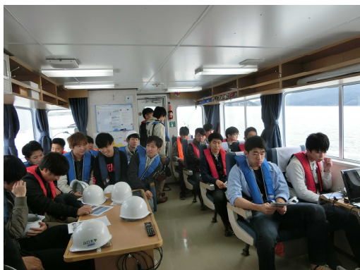
船で徳山下松港を見学する様子