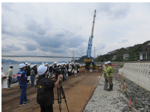
下関港海岸見学の様子