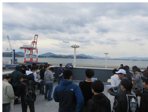
長州出島見学の様子