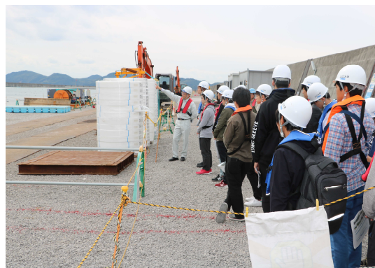
工事現場見学の様子