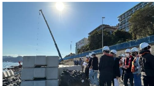
下関港海岸見学の様子