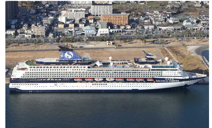
船名：SkySea Golden Era (スカイシー・ゴールデン・エラ) 運航会社：スカイシー・クルーズ (中国) 船籍：マルタ 総トン数：72,458t 乗客定員：1,814人 初寄港：平成28年1月10日