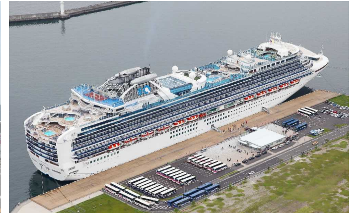
船名：Sapphire Princess (サファイヤ・プリンセス) 運航会社：プリンセス・クルーズ (アメリカ) 船籍：イギリス 総トン数：115,875t 乗客定員：2,678人 初寄港：平成29年5月16日