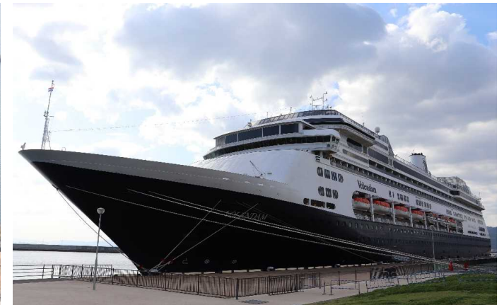
船名：Volendam (ヴォレンダム) 運航会社：ホーランド・アメリカライン (アメリカ) 船籍：オランダ 総トン数：61,214t 乗客定員：1,432人 初寄港：平成30年4月8日