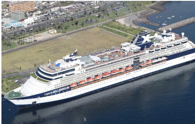
船名：Celebrity Millennium (セブリティ・ミレニアム) 運航会社：セブリティクルーズ (アメリカ) 船籍：マルタ 総トン数：90,963t 乗客定員：2,158人 初寄港：平成27年10月3日