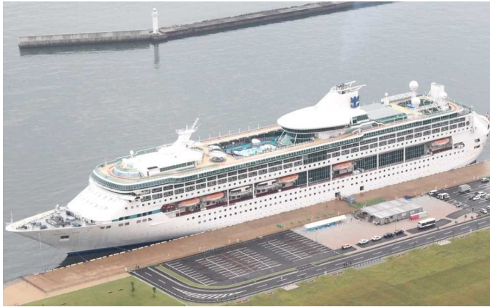
船名：Legend of the Seas (レジェント・オブ・ザ・シーズ) 運航会社：ロイヤル・カリビアン・インターナショナル (アメリカ) 船籍：バハマ 総トン数：69,130t 乗客定員：1,804人 初寄港：平成23年8月10日