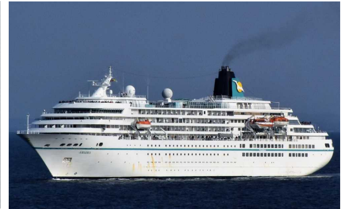
船名：Amadea (アマデア) 運航会社：フェニックスライゼン (ドイツ) 船籍：バハマ 総トン数：29,008t 乗客定員：600人 初寄港：平成25年3月27日