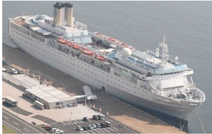
船名：Club Harmony (クラブ・ハーモニー) 運航会社：ハーモニークルーズ (韓国) 船籍：韓国 総トン数：25,558t 乗客定員：810人 初寄港：平成24年3月13日