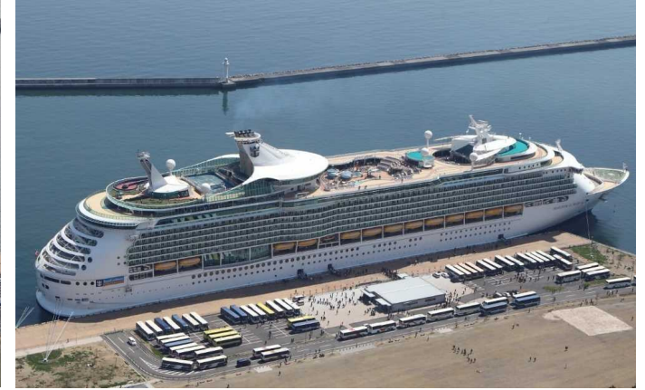
船名：Mariner of the Seas (マリナー・オブ・ザ・シーズ) 運航会社：ロイヤル・カリビアン・インターナショナル (アメリカ) 船籍：バハマ 総トン数：138,279t 乗客定員：3,114人 初寄港：平成27年3月28日