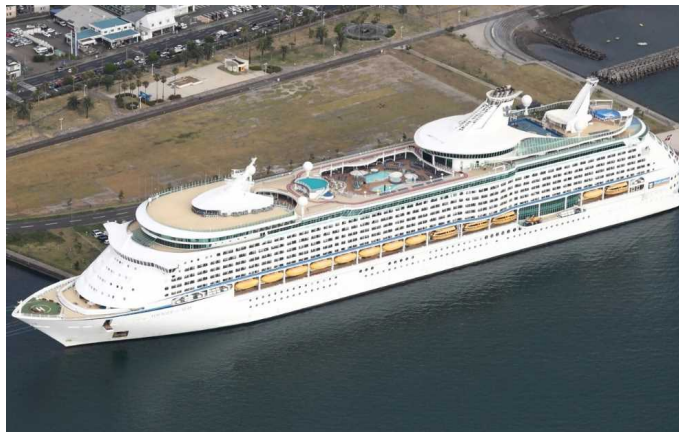
船名：Voyager of the Seas (ボイジャー・オブ・ザ・シーズ) 運航会社：ロイヤル・カリビアン・インターナショナル (アメリカ) 船籍：バハマ 総トン数：138,194t 乗客定員：3,286人 初寄港：平成26年5月12日