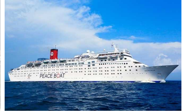
船名：Ocean Dream (オーシャン・ドリーム) 運航会社：ピースボートクルーズ (日本) 船籍：パナマ 総トン数：35,265t 乗客定員：1,422人 初寄港：平成29年3月29日