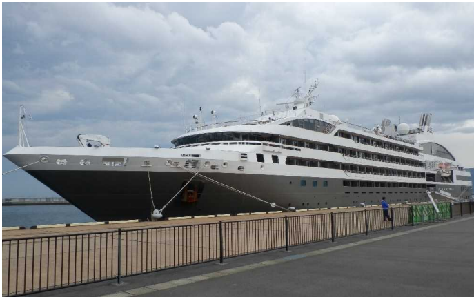
船名：L' Austral (ロストラル) 運航会社：ホナン (フランス) 船籍：フランス 総トン数：10,944t 乗客定員：264人 初寄港：平成27年4月3日