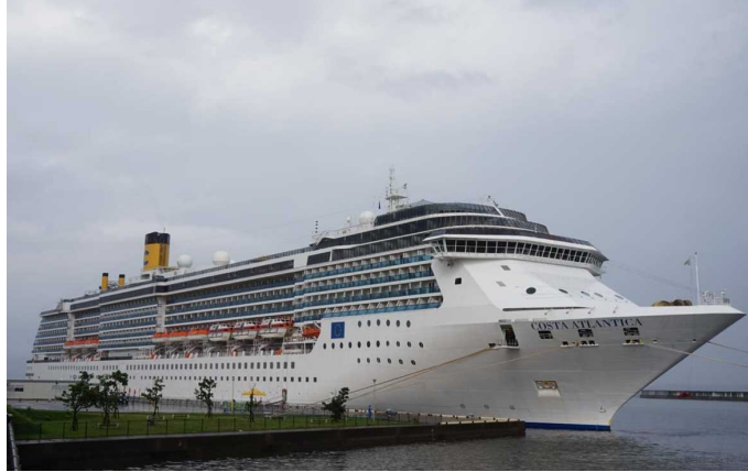
船名：Costa Atlantica (コスタ アトランチカ) 運航会社：コスタクルーズ (イタリア) 船籍：イタリア 総トン数：85,619t 乗客定員：2,114人 初寄港：平成29年9月27日