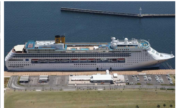
船名：Costa Victoria (コスタ・ビクトリア) 運航会社：コスタクルーズ (イタリア) 船籍：イタリア 総トン数：75,166t 乗客定員：1,928人 初寄港：平成26年5月16日