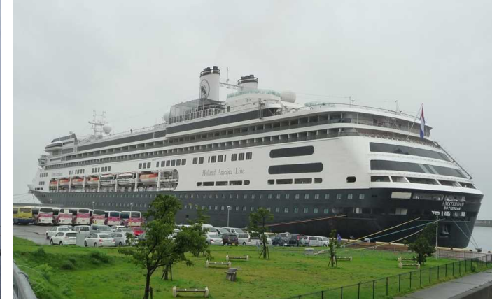
船名：Amsterdam (アムステルダム) 運航会社：ホーランド・アメリカライン (アメリカ) 船籍：オランダ 総トン数：62,735t 乗客定員：1,380人 初寄港：平成29年10月19日