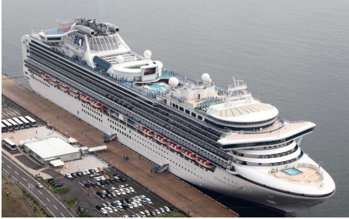
船名：Diamond Princess (ダイヤモンド・プリンセス) 運航会社：プリンセス・クルーズ (アメリカ) 船籍：イギリス 総トン数：115,906t 乗客定員：2,706人 初寄港：平成26年7月12日