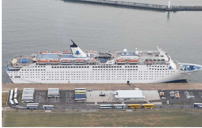
船名：Henna (ヘナ) 運航会社：HNAクルーズ (中国) 船籍：マルタ 総トン数：47,262t 乗客定員：1,486人 初寄港：平成26年11月20日