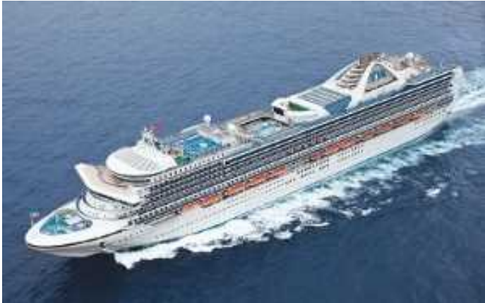
船名：Golden Princess (ゴールデン・プリンセス) 運航会社：プリンセス・クルーズ (アメリカ) 船籍：イギリス 総トン数：108,865t 乗客定員：2,636人 初寄港：平成28年5月3日