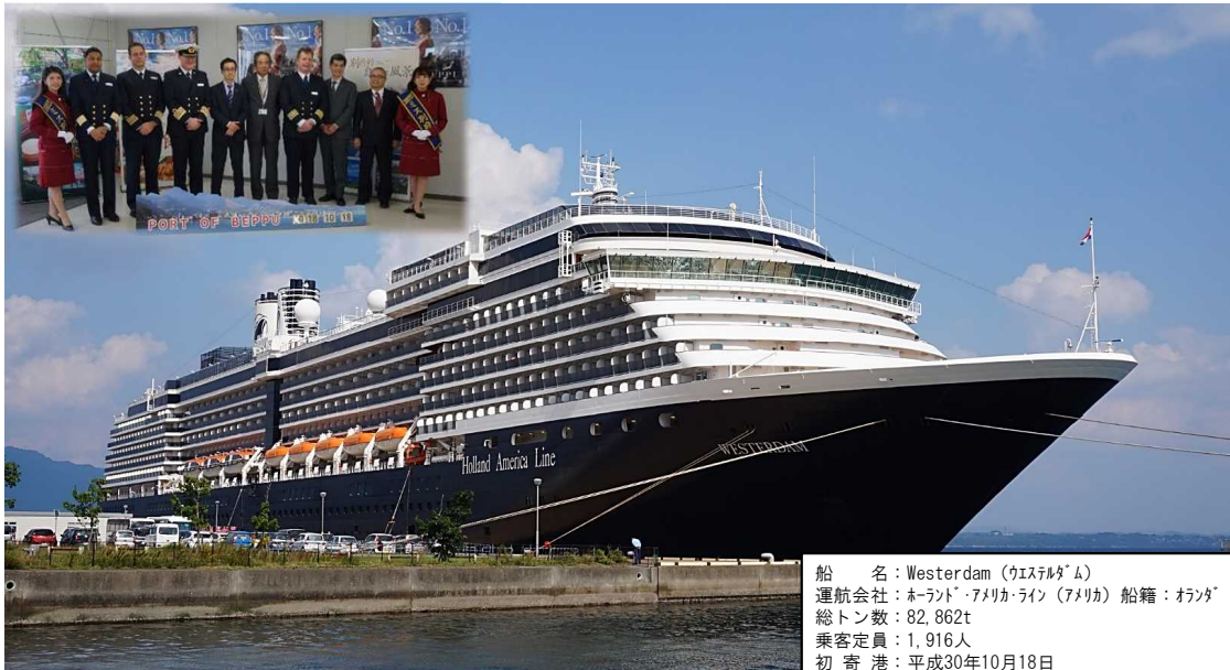
船名: Westerdam (カステルダム) 運航会社: オランダ・アメリカ・ライン (アメリカ) 船籍: オランダ 総トン数: 82,862t 乗客定員: 1,916人 初寄港: 平成30年10月18日