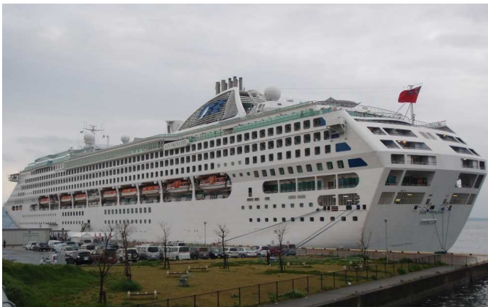
船名：Sun Princess (サン・プリンセス) 運航会社：プリンセス・クルーズ (アメリカ) 船籍：バミューダ 総トン数：77,441t 乗客定員：2,010人 初寄港：平成25年6月3日