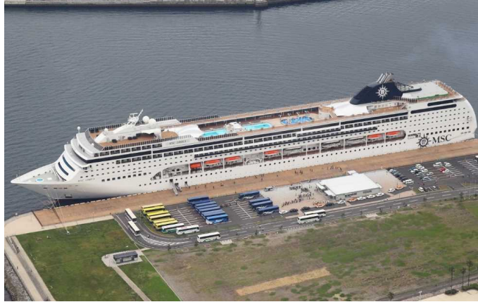
船名：MSC Lirica (MSCリリカ) 運航会社：MSCクルーズ (スイス) 船籍：パナマ 総トン数：65,591t 乗客定員：1,984人 初寄港：平成28年6月6日