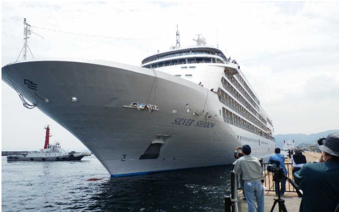
船名：Silver Shadow (シルヴァー・シャドウ) 運航会社：シルバーシー・クルーズ (モナコ) 船籍：パナマ 総トン数：28,258t 乗客定員：382人 初寄港：平成29年4月27日