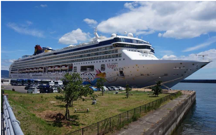
船名：SuperStar Virgo (スーパースター・ヴァーゴ) 運航会社：スタークルーズ (香港) 船籍：バハマ 総トン数：75,338t 乗客定員：1,870人 初寄港：平成29年10月30日