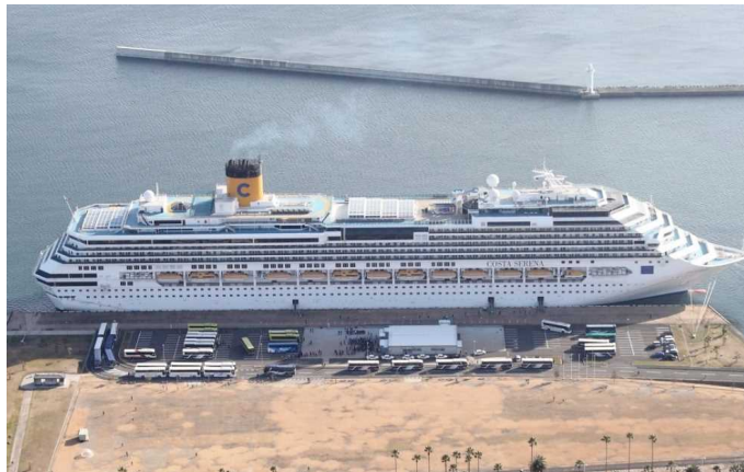
船名：Costa Serena (コスタ セレナ) 運航会社：コスタクルーズ (イタリア) 船籍：イタリア 総トン数：114,261t 乗客定員：2,930人 初寄港：平成30年1月2日