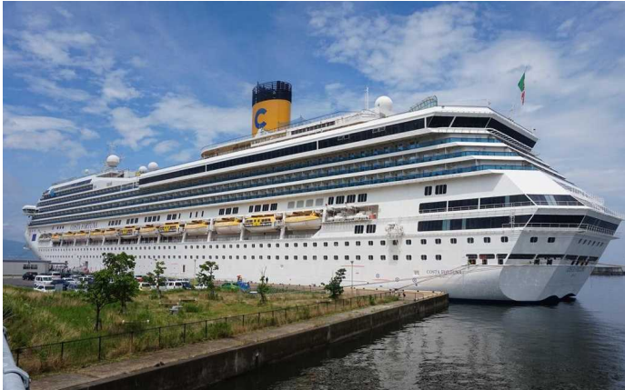
船名：Costa Fortuna (コスタ フォーチュナ) 運航会社：コスタクルーズ (イタリア) 船籍：イタリア 総トン数：102,669t 乗客定員：2,702人 初寄港：平成29年6月30日