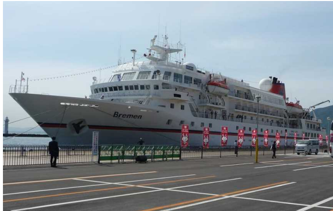
船名：Bremen (ブレイメン) 運航会社：ハプクローイト・クルーズ (ドイツ) 船籍：パナマ 総トン数：6,752t 乗客定員：155人 初寄港：平成29年5月15日