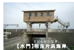
【水門】相良片浜海岸

東日本大震災において、水門・陸閘等の現場操作員が多数犠牲となりました。海岸関係省庁（農林水産省及び国土交通省）は、この教訓を踏まえ、 現場操作員の安全の確保を最優先とし、水門・陸閘等の操作を確実に実施できる管理体制の構築に資するため、本年1月より「水門・陸閘等の効果的な管理運用検討委員会」を設置し、検討を行ってまいりました。 （別紙1）