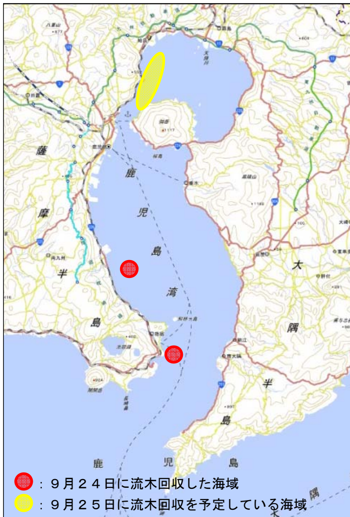
流木回収海域及び回収予定海域