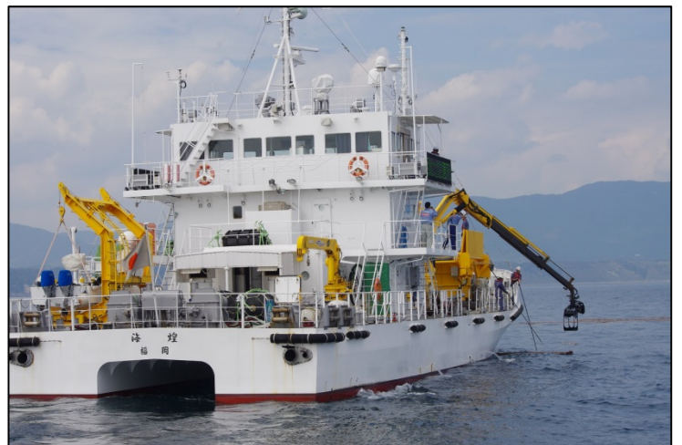
海煌の多関節クレーンを使用した流木回収状況