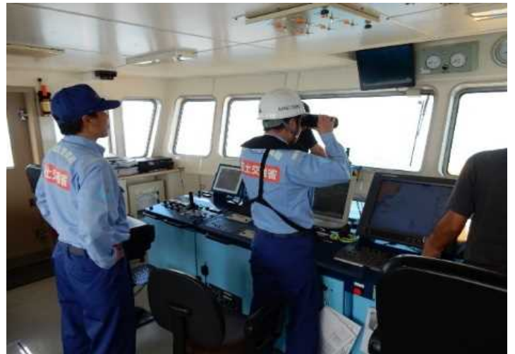
流木の目視監視状況