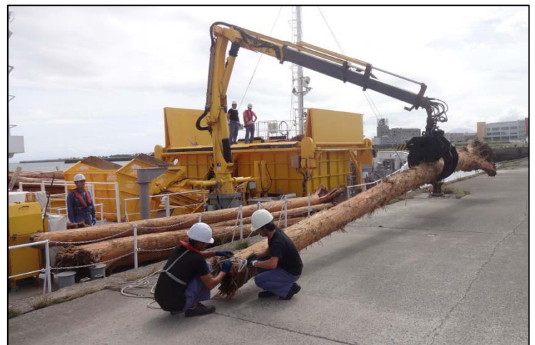
多関節クレーンを使用した回収流木の揚陸（12mの長尺流木）