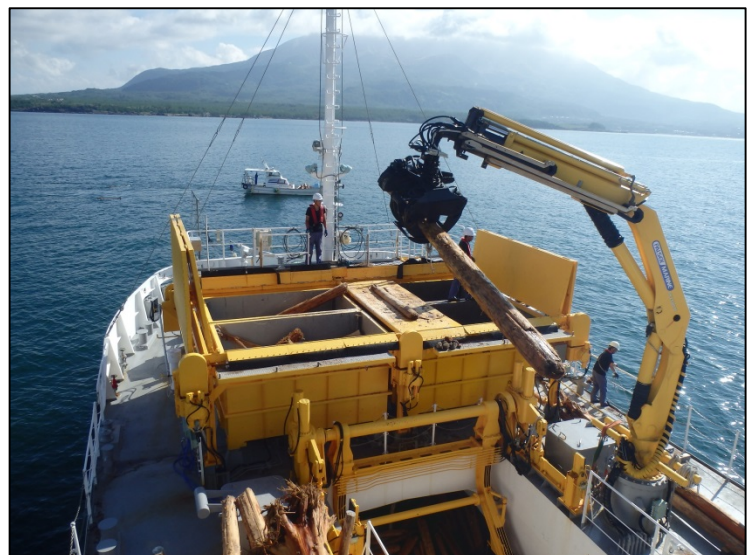
多関節クレーンを使用した流木の回収