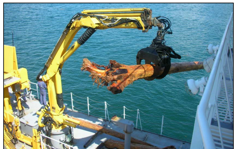
多関節クレーンを使用した流木の回収