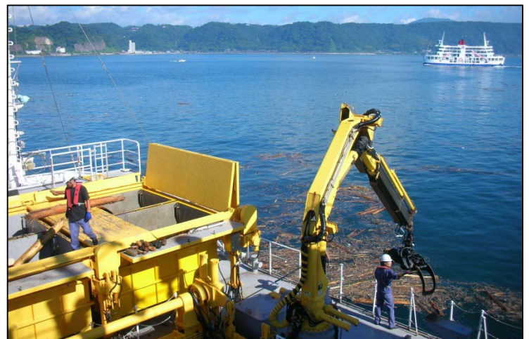
フェリーが行き交う航路付近での流木の回収