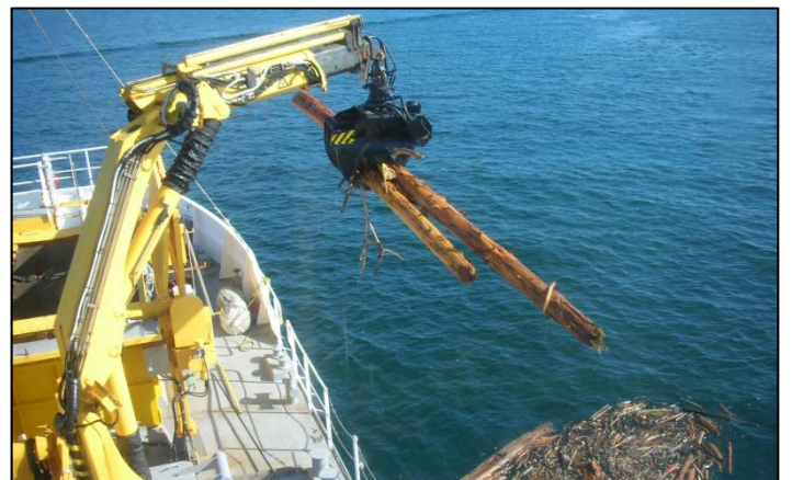
多関節クレーンにより流木2本を一度に回収