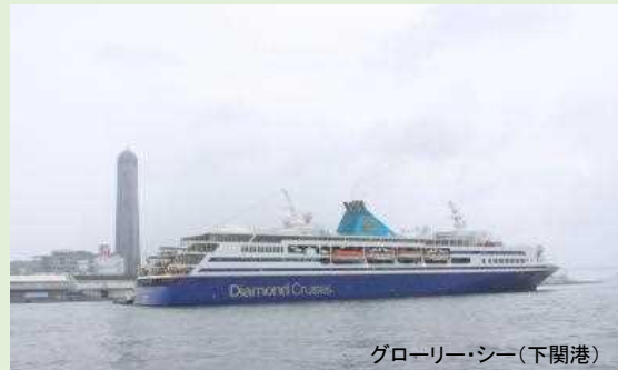
グローリー・シー(下関港)

「グローリー・シー」が 改装後、初航海で下関港へ寄港しました。 下関港への寄港は、日本国内での初寄港です。