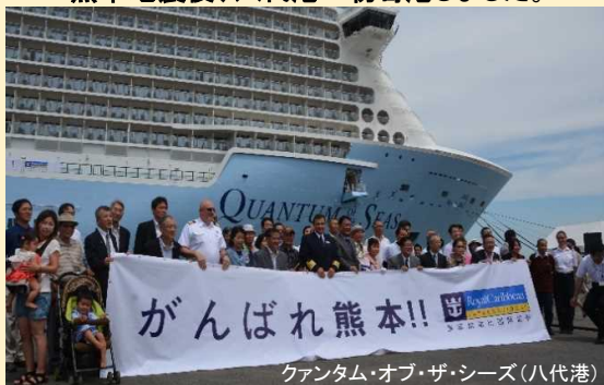
クァンタム・オブ・ザ・シーズ(八代港)

大型クルーズ船「クァンタム・オブ・ザ・シーズ」が 熊本地震後、八代港へ初寄港しました。