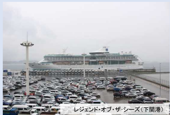
レジェンド・オブ・ザ・シーズ(下関港)

「レジェンド・オブ・ザ・シーズ」が 下関港へ初寄港しました。 7万トンのクルーズ船の寄港は、山口県内初です。