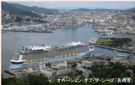
オペーション・オブ・ザ・シーズ(長崎港)

アジア最大級のクルーズ客船 「オペーション・オブ・ザ・シーズ」が 九州の長崎港、博多港、八代港へ初寄港しました。 長崎港への寄港は、日本国内での初寄港です。