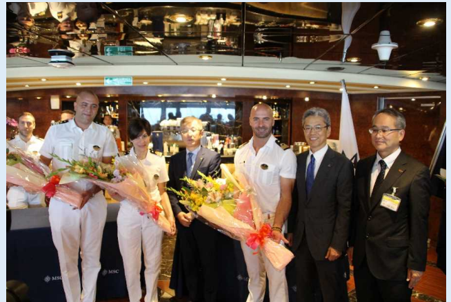
八代港入港時の初寄港セレモニー（花束贈呈）の様子