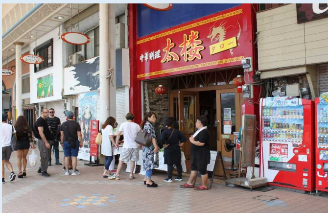
八代市内の商店街で食事する乗客