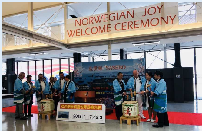
初寄港セレモニーの様子