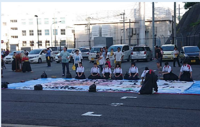
佐世保港お見送り時の地元高校生による 書道パフォーマンスの様子