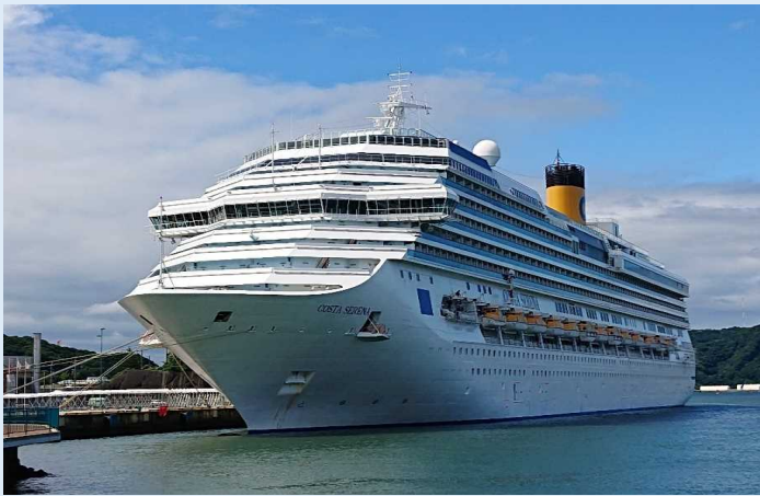
コスタ・セレーナ（佐世保港）

上海を出港して、前日に北九州を訪れた乗船客は約3,500人で、佐世保の代表的な観光地である「九十九島」を訪れたり、免税店でのショッピングを楽しみました。