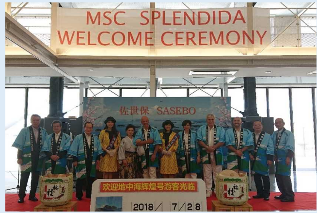
佐世保港入港時の初寄港セレモニー（記念撮影）の様子