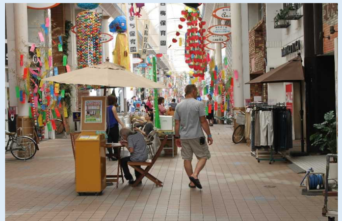
八代市内の商店街を歩く乗客