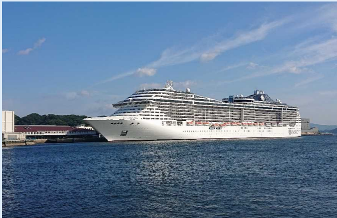
MSCスプレディダ（佐世保港）

佐世保港では、地元団体による日本舞踊を皮切りに、初寄港を祝うセレモニーが開催され、市長と同船船長で記念品の交換等が行われました。約3,300人の乗客は佐世保市内の観光地を訪れたり、買い物を楽しみました。また、見送りの際には、地元高校生による和太鼓と書道の共演が今回初めて行われ、乗客からは大きな拍手が沸き起こる等、大変好評でした。