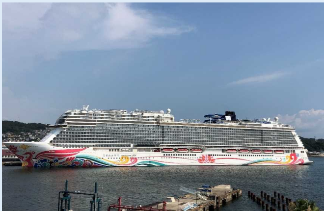
ノルウェー・ジョイ（佐世保港）