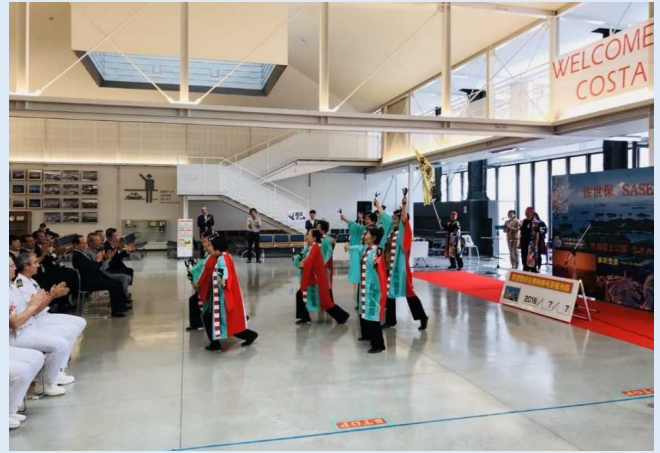
地元よさこいチームによる歓迎のよさこい （初寄港セレモニー）の様子