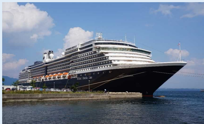
「ウエステルダム」(別府港)

別府港、佐世保港の各港で歓迎式典が催され、別府港ではミス別府から同船船長への花束贈呈や港湾関係者との記念品交換が行われました。別府港を訪れた乗客は、別府市内の地獄巡りや大分県内の観光地巡りを楽しみました。また、佐世保港を訪れた乗客は、九十九島やハウステンボスなど佐世保市内を中心に観光地を巡りました。