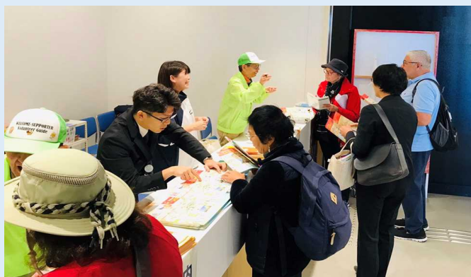
乗客に対応する地域の観光協会やボランティアの方たち(佐世保港)