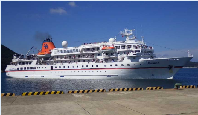
「ブレーメン」（青方港）

唐津港では、乗客が唐津市内や焼き物で有名な有田町、伊万里市の観光地を訪れ、天候上の理由により入港時の歓迎行事は中止されましたが、出港時には市民が手を振ってお見送りしました。