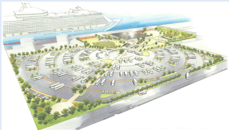
八代港クルーズ拠点 コンセプト図

写真左より 熊本県 営業部長兼しあわせ部長「くまモン」 熊本県 蒲島知事 ロイヤルカリビアン社 ジョン・ターセック副社長 九州地方整備局 村岡副局長