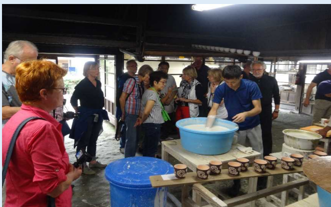
源右衛門窯の工房を見学する乗客（有田町）