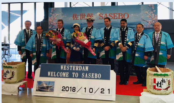
歓迎式典の様子(佐世保港)