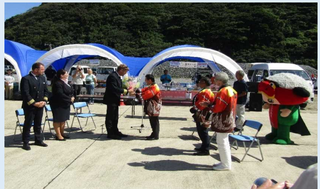
花束贈呈の様子（青方港）