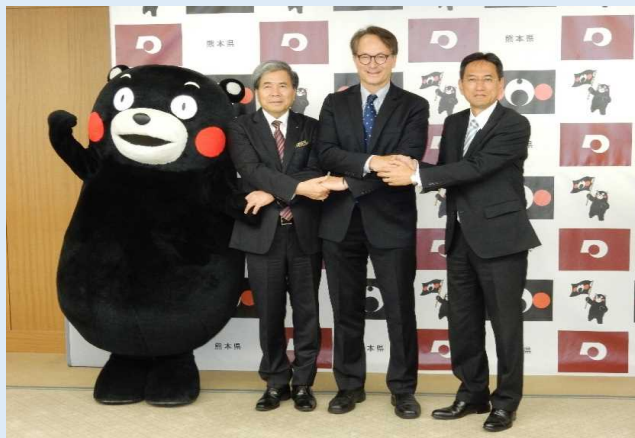
合同記者発表 フォトセッション

2018年10月5日に、八代港クルーズ拠点の基本計画について、熊本県、ロイヤルカリビアン社及び国土交通省の三者合同で記者発表を行いました。