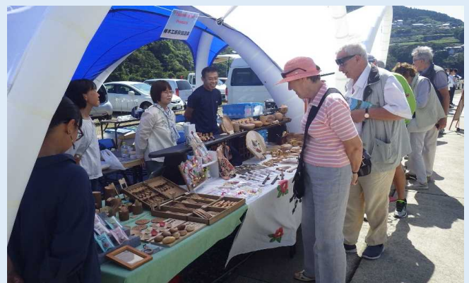
地元特産品販売の様子（青方港）