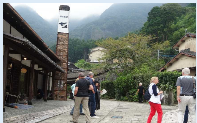
大川内山を観光する乗客（伊万里市）