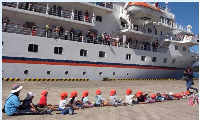
乗客を出迎える園児たち（青方港）