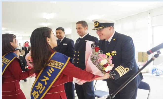
ミス別府から同船船長らへの花束贈呈の様子(別府港)