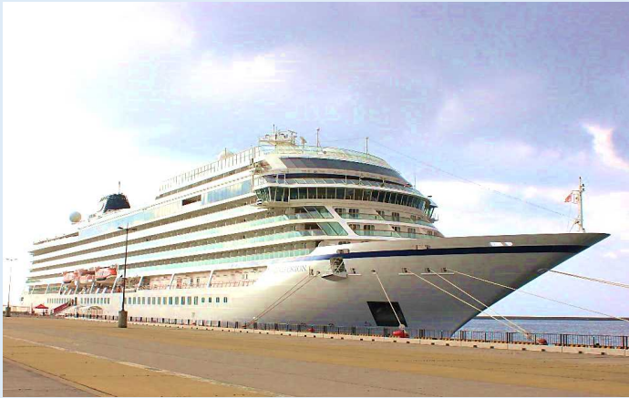
バイキング・オリオン（鹿児島港）