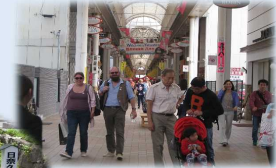
乗客で賑わう商店街