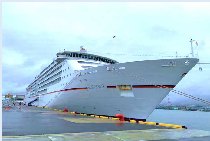
オイローパ2 (博多港)