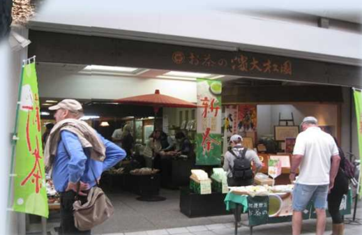
商店街で買い物する乗客