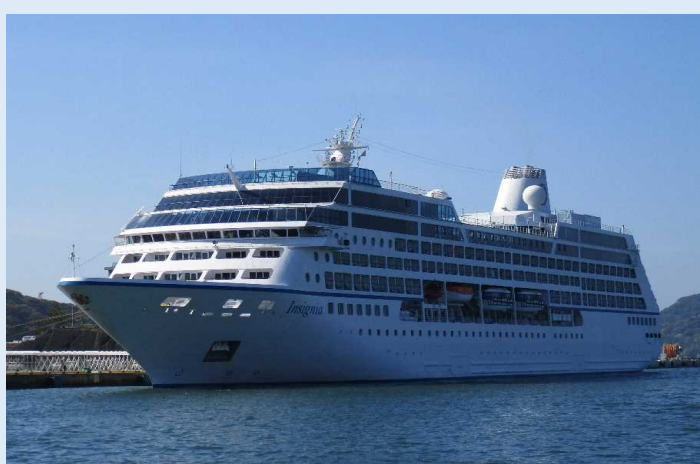
インシグニア (佐世保港)