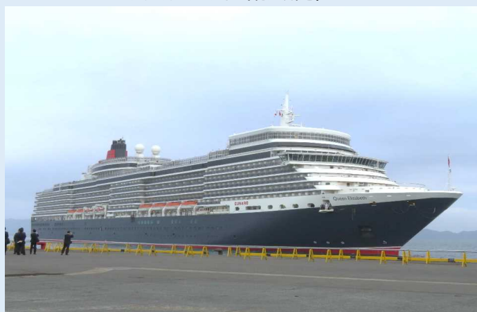
クイーン・エリザベス (八代港)