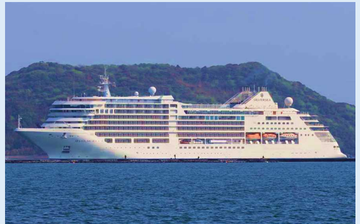
シルバー・ミュージ（唐津港）