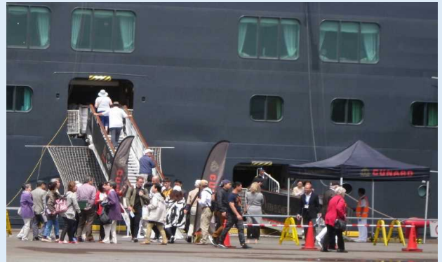
乗客は下船し、物産展や観光へ