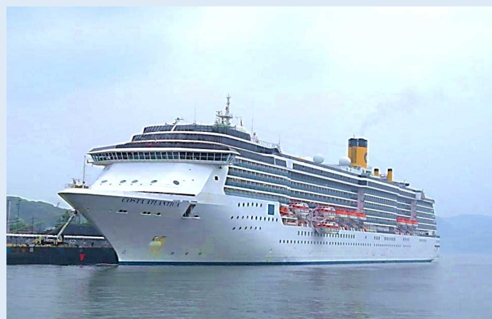
コスタ・アトランチカ (佐世保港)