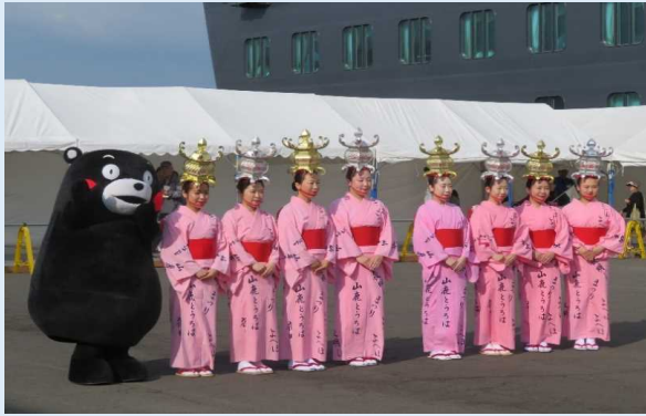
入港イベント(山鹿灯籠踊りの方々とくまモン)

熊本県や八代市などでつくる「八代港クルーズ客船受入実行委員会」は停泊地北側の岸壁に一般向けの見学地を開設し、一般見学者用のシャトルバスを運行しました。