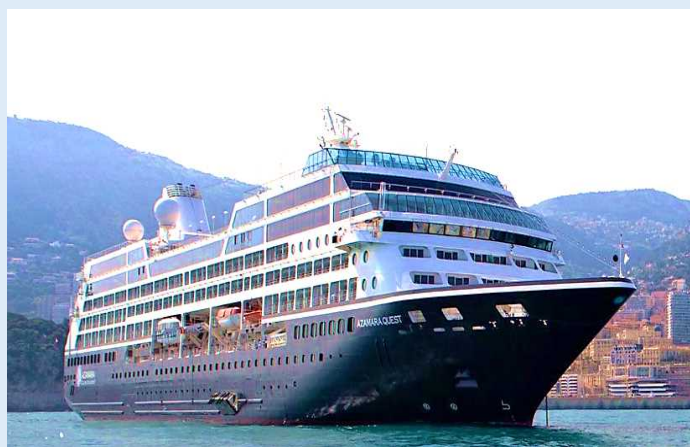
アザマラ・クエスト (北九州港)