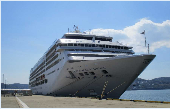
セブンシーズ・マリナー（佐世保港）