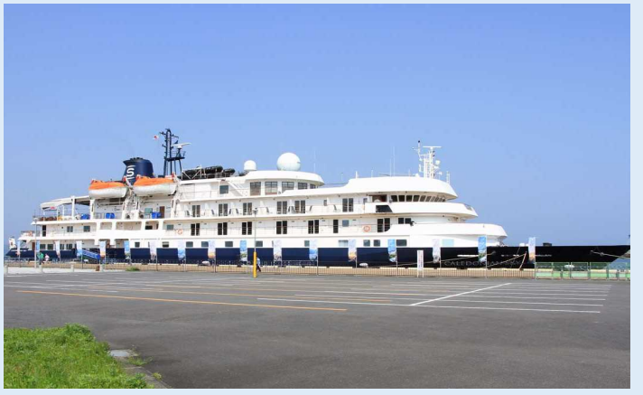
カレドニアンスカイ（別府港）