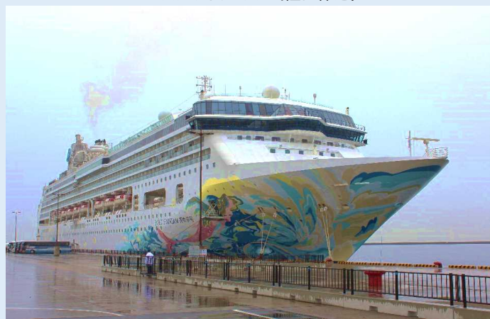
エクスプローラー・ドリーム (鹿児島港)