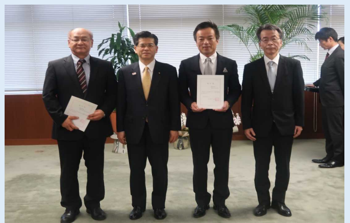
記念撮影 （左から）田原那覇港管理組合常勤副管理者、石井国土交通大臣、前田下関市長、下司港湾局長