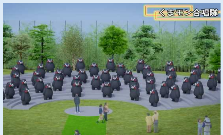
くまモン合唱隊（完成イメージ）