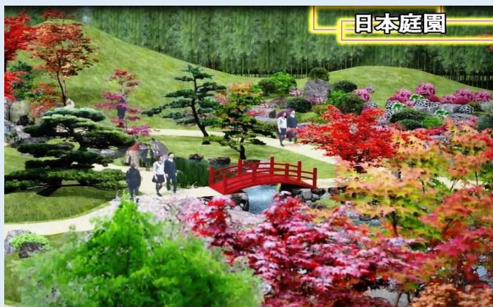
日本庭園（完成イメージ）

（左から：くまモン、ロイヤルカリビアン社 ジェームス・ボインク・ジュニア氏、熊本県 蒲島知事、九州地方整備局 神谷港湾空港部長）