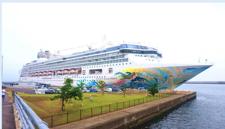
別府港に初寄港した「エクスプローラー・ドリーム」

2019年7月17日、中国のドリームクルーズ社が運航する「エクスプローラー・ドリーム」（総トン数：75,338トン）が乗客2,387人を乗せて、別府港に初寄港しました。本クルーズは、天津→下関→別府→天津の行程で、初寄港イベントでは船社へ記念品が贈られました。2019年4月から就航を開始した同船は、既に九州4港（鹿児島港、博多港、長崎港、下関港）に初寄港しています。