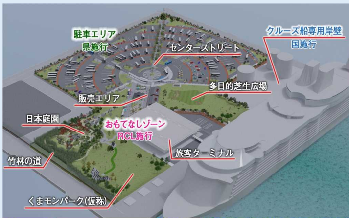
八代港クルーズ拠点 完成イメージ

（注1） http://www.pref.kumamoto.jp/kiji_28273.html