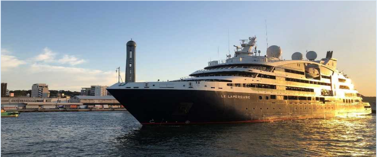
ル・ラペルーズ（下関港）

出港時には物産品の販売が行われたほか、保育園の園児が歌や踊りが披露し、乗客を見送りました。