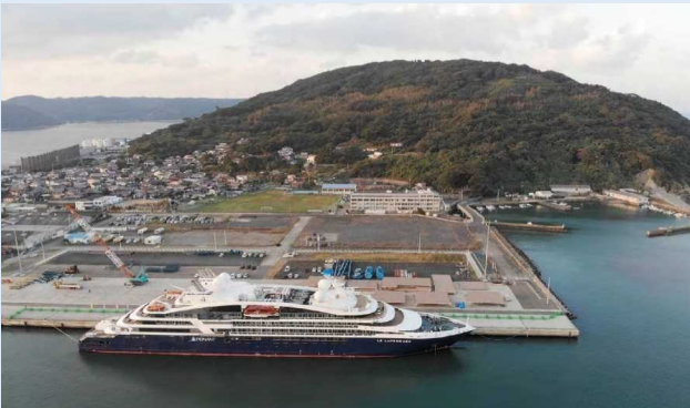
ル・ラペルーズ（唐津港）

本船は、大阪→高松→広島→唐津→長崎→上海（中国）→香港（中国）→ハロン湾（ベトナム）→ハイフォン（ベトナム）を15日間で巡る行程で、入港後は初寄港歓迎式典が行われたほか、船内見学も実施されました。そのほか、物産展では曳山展示場や唐津城売店の土産物が販売されました。オプションツアーでは、唐津の観光地を巡ったり、日本文化を体験しました（下記表参照）。出港時には、ゴスペルグループによる演奏で乗客を見送りました。