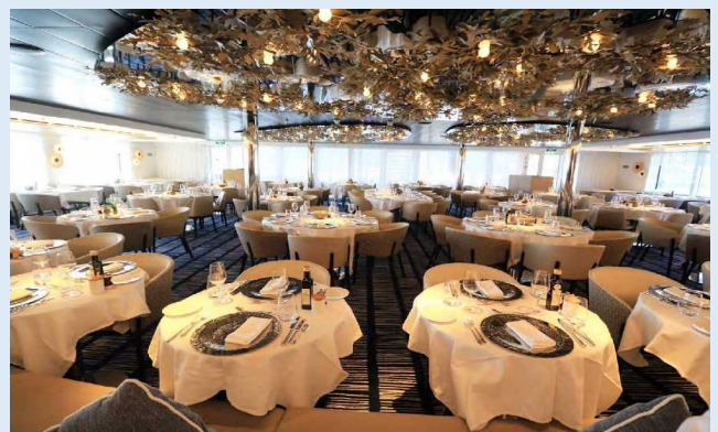
船内レストランの様子