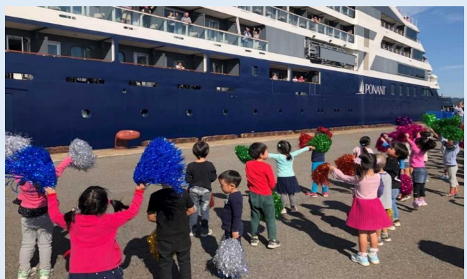
保育園の園児によるお見送り