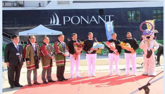
初寄港歓迎式典 記念撮影