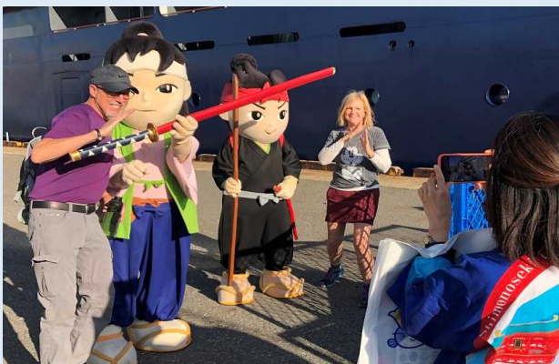
ご当地キャラによるお出迎え