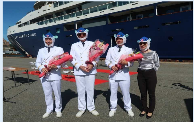
初寄港歓迎式典 記念撮影