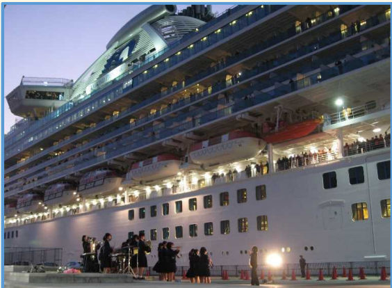
長崎南高等学校吹奏楽部による演奏