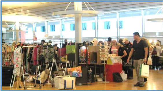
国際ターミナルで最後のショッピングを楽しむ乗客

また、出港時には長崎県立長崎南高等学校の吹奏楽部による演奏と「ありがとう」の言葉が贈られ、乗客の歓声と拍手がトワイライトに映し出された長崎港に鳴り響きました。