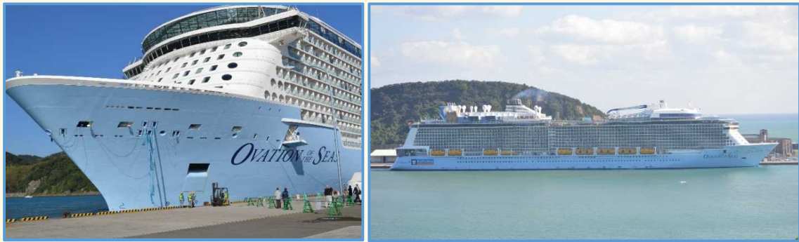
オベーション・オブ・ザ・シーズ（油津港）

船内では初寄港を歓迎する記念式典及び関係者向けの船内見学会が行われ、岸壁に設置されたバルーンテント内では、民芸品や焼酎など地元特産品が並び、クルーズ乗船客や乗組員が買い物を楽しみました。約4,100人もものクルーズ乗船客の多くは市内観光に繰り出し、日南市内の観光地は多くの観光客で賑わいました。