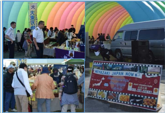
岸壁に設置されたバルーンテントの物産展