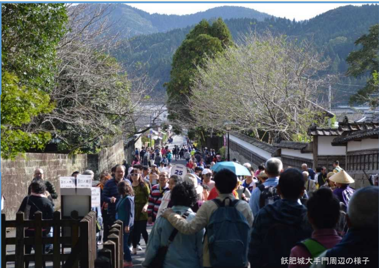
多くの観光客で賑わう日南市内の観光地