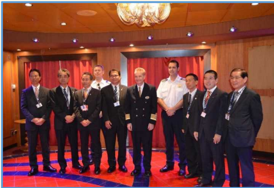
歓迎記念式典の様子