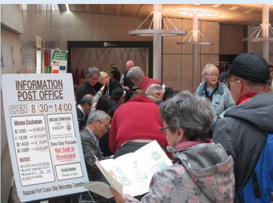
ボランティアスタッフによる観光案内を利用する乗客