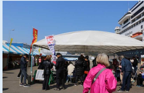
岸壁に設けられた無料Wi-Fiスポット