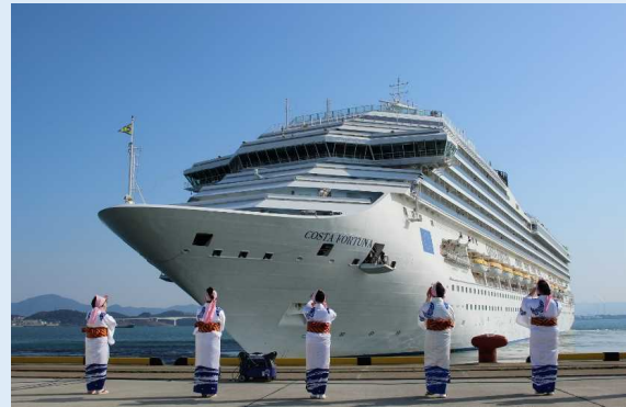
下関平家踊り保存会による平家踊りや平家太鼓の演奏によるお見送り