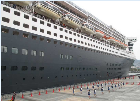
長崎女子商業高等学校の生徒による歓迎セレモニー

入港時には長崎女子商業高等学校の生徒による吹奏楽演奏とバトン演技が行われ、素晴らしい演奏と演技に乗客・乗員から惜しめない歓声と拍手が送られていました。