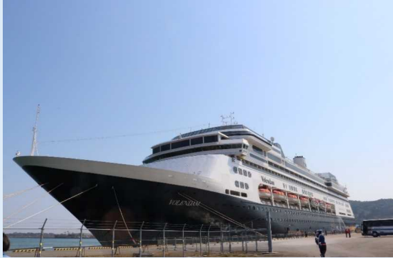
フォーレンドム（細島港）

乗船客の約9割は欧米人で、港では初寄港を記念した歓迎式典のほか、物産展も開催されました。