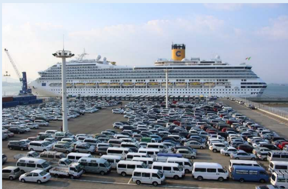
コスタ・フォーチュナ（下関港）

下関平家踊り保存会による平家踊りや平家太鼓の演奏による歓迎、岸壁では県産品の物産展、初寄港を記念した歓迎式典なども開催されました。