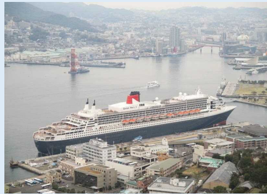
今回のワールドクルーズにおいて日本は長崎港のみに寄港