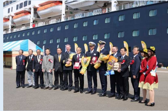
「フォーレンドム」の初寄港を記念した歓迎式典