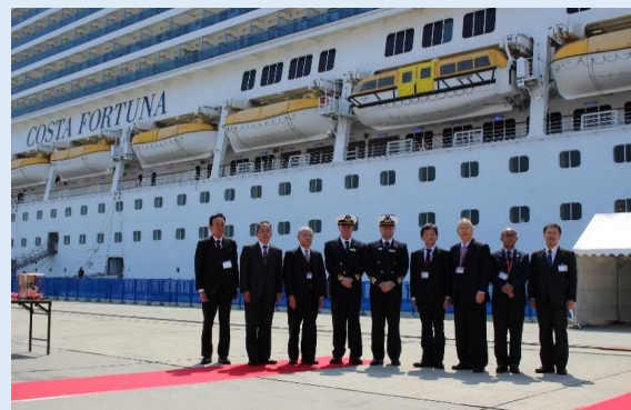
「コスタフォーチュナ」の初寄港を記念した歓迎式典