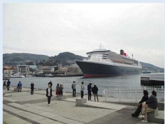
福岡や熊本など他県から船を見るために来訪した方も