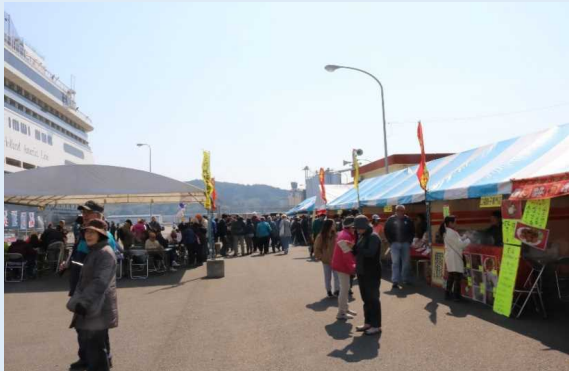
岸壁で開催された物産展