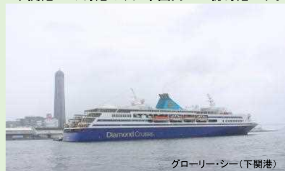
グローリー・シー(下関港)

「グローリー・シー」が 改装後、初航海で下関港へ寄港しました。 下関港への寄港は、日本国内での初寄港です。