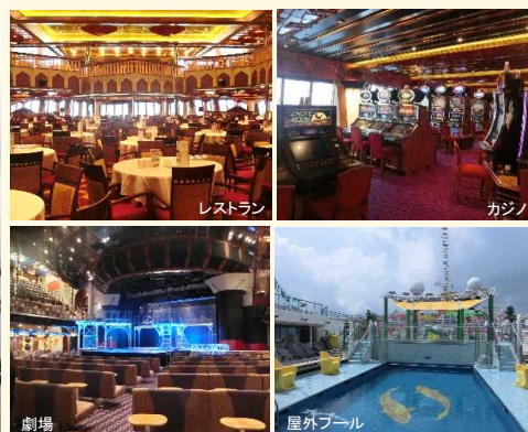
「コスタ・フォーチュナ」船内の様子