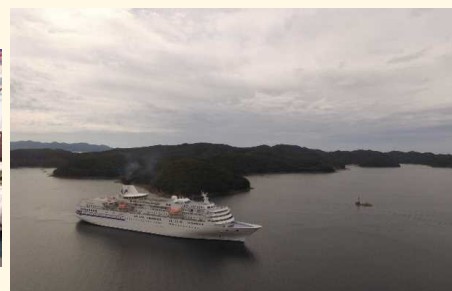
浅茅湾に浮かぶ「ばしふいっくびいなす」