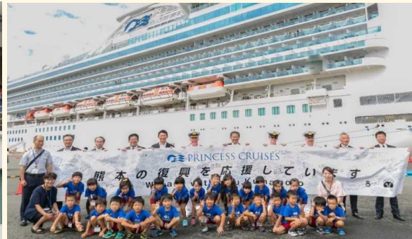
復興を応援する横断幕と一緒に記念撮影する地元幼稚園児