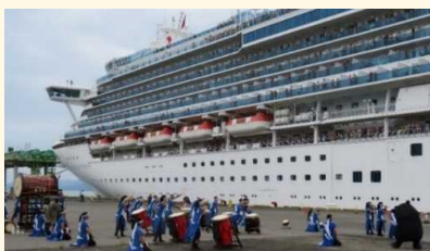
地元秀岳館高校太鼓部による「雅太鼓」と「くまモン」によるお見送り