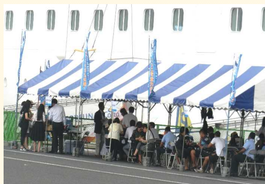
岸壁には特設のインフォメーション(テント左)と無料Wi-Fiスポット(テント中央から右)。乗客だけでなく船員の制服姿も。