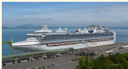
ダイヤモンド・プリンセス（八代港）