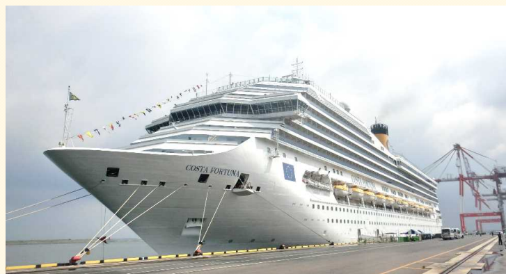
コスタ・フォーチュナ(北九州港)

上陸した乗客は、貸切バス80台で福岡市内へ向かい、うち20台は福岡に加え北九州市内もまわり、歴史・文化観光を楽しみました。また、船員向けの地元観光地を巡る旅のおもてなしが特別に用意され、船員の方々も北九州を満喫しました。