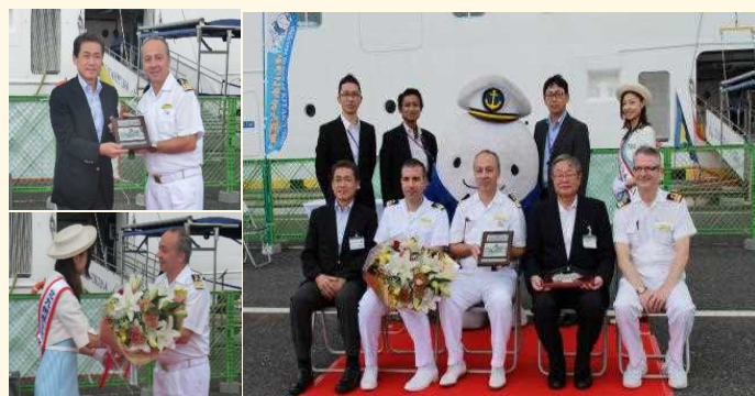
歓迎式典の様子。2009年に北九州港が開港120周年を迎えた時にマスコットキャラクターとして誕生した「スナQ」も一緒にお出迎え。