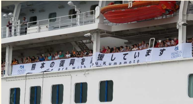
復興を応援する横断幕を掲げ入港

岸壁では歓迎式典が行われ、4月に発生した熊本地震からの復興を願い、同船乗客や乗組員がメッセージを書き込んだ横断幕が八代市へ贈呈されました。同船はそのほかにも地元の幼稚園児や高校生など総勢約100名を招待した「船内見学会」、熊本県への寄付金を乗客に募る船内イベント「チャリティー・ウォーク」を催すなど、復興に向けて元気づけてくれました。出港時は、熊本県PRマスコット・キャラクター「くまモン」がかけつけ、地元秀岳館高校太鼓部による雅太鼓の演奏とともにお見送りしました。