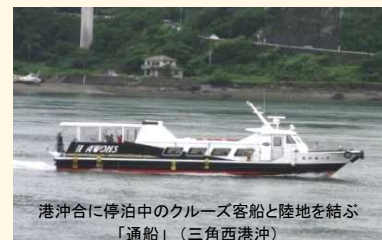
港沖合に停泊中のクルーズ客船と陸地を結ぶ「通船」(三角西港沖)

同船初寄港となる玉ノ浦港(長崎県五島市)、三角西港(熊本県)、指宿港(鹿児島県)では、港の沖合に同船が停泊し、乗客は小型の『通船』で港へ上陸しました。三角西港では、上陸客が「明治日本の産業革命遺産」として平成27年7月に世界遺産登録された同港一帯を散策したり、バスツアーで天草市などへ向かいました。