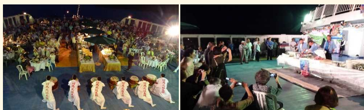
浅茅湾を眺めながらのデッキディナーで地元歓迎イベント「元寇太鼓」【写真左】や「マクロ解体ショー」【写真中央】を楽しむクルーズ船乗客の様子

当初寄港予定がなくクルーズ出発後のサプライズとして乗客に寄港が知らされた玉ノ浦港では、住民らが上陸客へ地元特産品を振る舞い、また、浅茅湾[あそうわん](長崎県対馬市)沖停泊時は、同船デッキ上で様々なイベントが行われ、乗客は風光明媚な浅茅湾を眺めながらのデッキディナーを楽しんだとのこと。