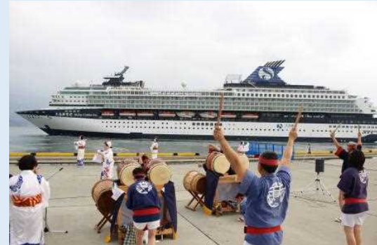
平家踊り・平家太鼓の演舞によるお見送り