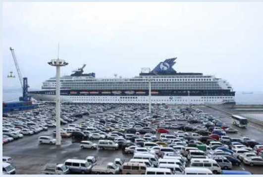
スカイシー・ゴールデン・エラ（下関港）