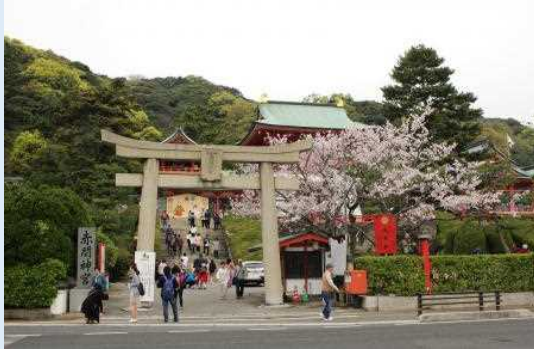
下関市内を観光する乗客(赤間神宮)