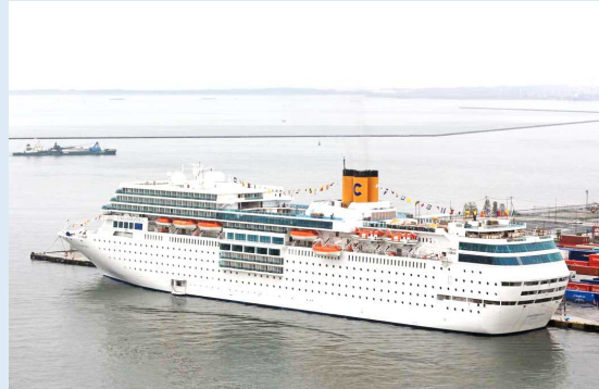
コスタ・ネオロマンチカ（博多港）