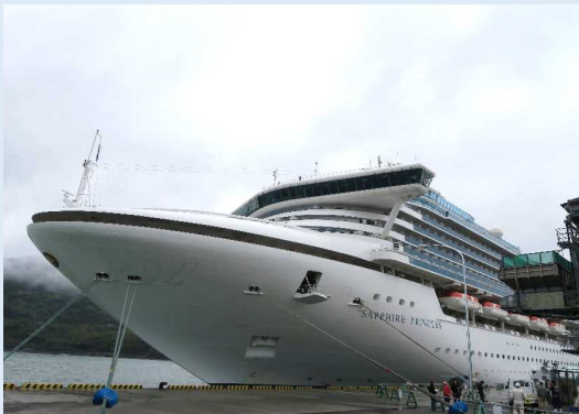
サファイア・プリンセス（油津港）

4月11日、アメリカのプリンセス・クルーズ社が運航するクルーズ客船「サファイア・プリンセス」(115,875ト)が、油津港（宮崎県）へ初寄港（県内でも初めて）をしました。初寄港を記念した歓迎式典では、歓迎挨拶や花束贈呈、記念品の交換などに続き、日南酒造協同組合から船長らに県南焼酎をプレゼントしてPRし、県南焼酎を使った鏡開きが行われました。上陸した乗員は、バス約75台に分乗し、鶴戸神宮や照葉大吊橋、飫肥城下町などを観光し、免税店などで買い物を楽しみました。