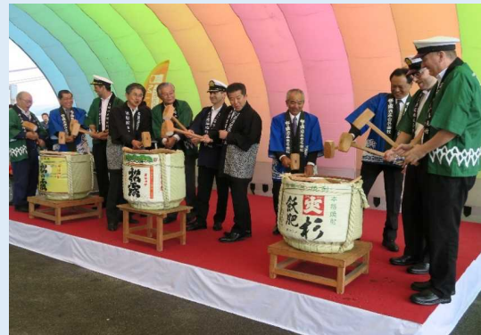
船長や日南商工会議所、日南酒造協同組合、行政関係者などによる県南焼酎を使った鏡開きの様子