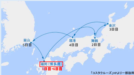
4月26日博多港出港のクルーズコース(Bコース)