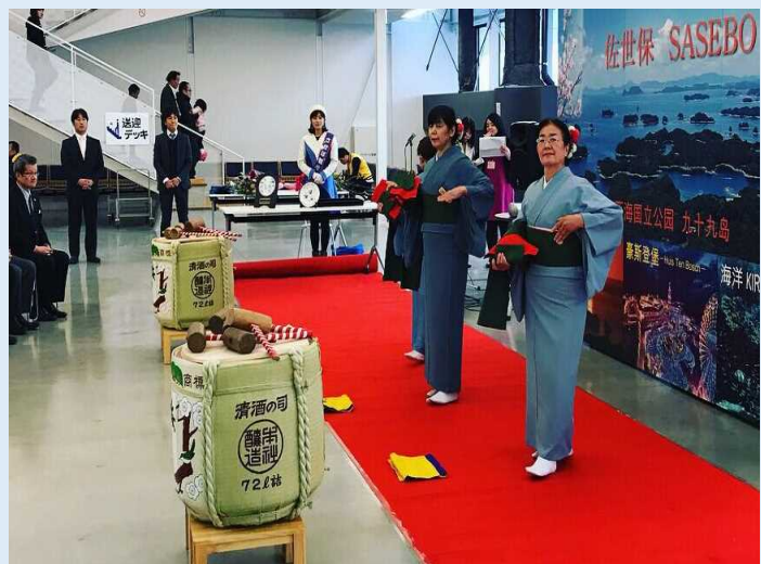
歓迎の「帯舞（おびまい）」の様子