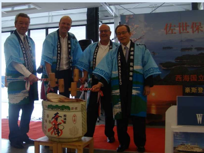
地酒の鏡開きの様子