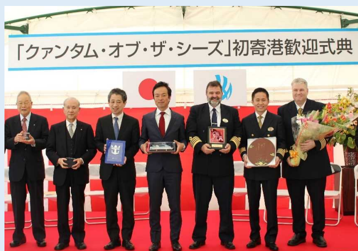
歓迎セレモニーの様子