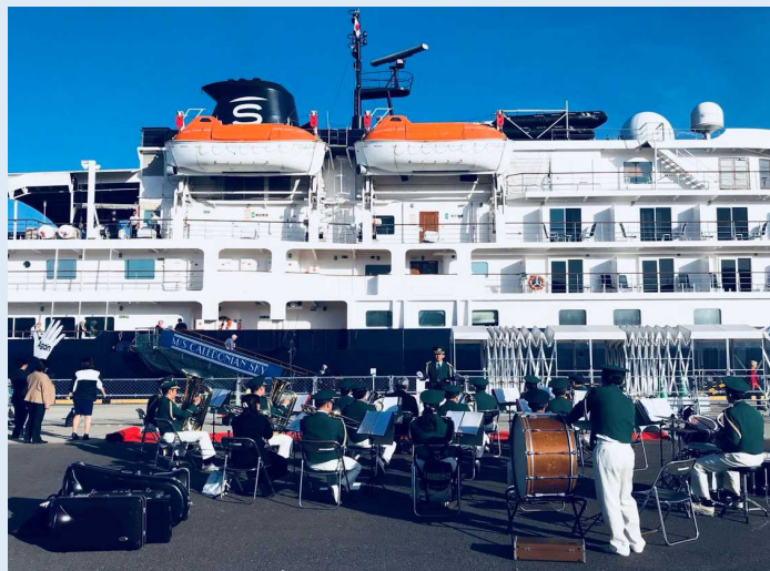
消防音楽隊による歓迎演奏