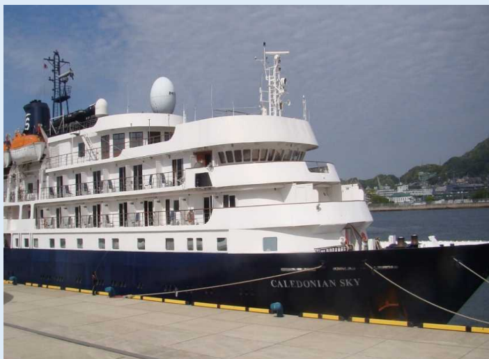
「カレドニアンスカイ」 佐世保港

セレモニーの最後は、佐世保市と同船の繁栄を祈念して、出席者の代表による地酒の鏡開きが行われるなど、温かいムードの歓迎となりました。