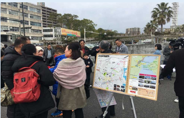
観光案内を聞くシャトルバス利用客 (ドルフィンポート)