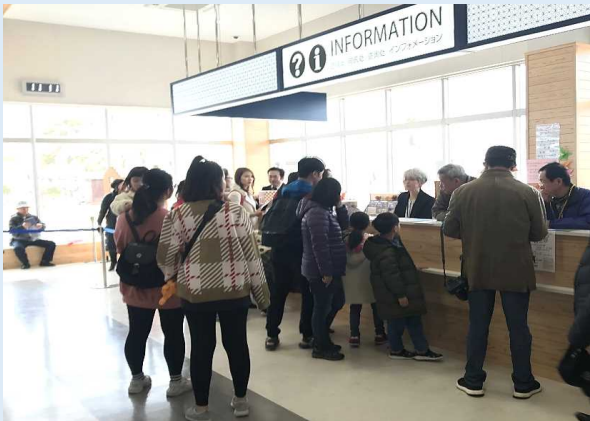
観光案内所の様子 (マリンポートかごしま)

また、観光庁はシャトルバス利用客に観光に使った金額や訪問先等についてのアンケートを実施し、分析した上でクルーズ船が寄港する自治体での取り組みに生かしたいとのことです。