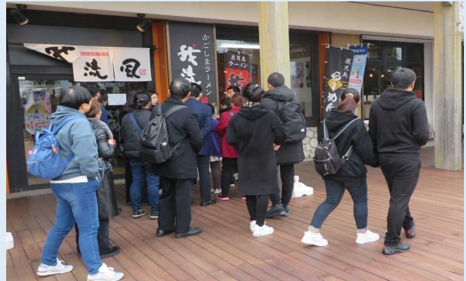
食事を楽しむシャトルバス利用客 (ドルフィンポート)