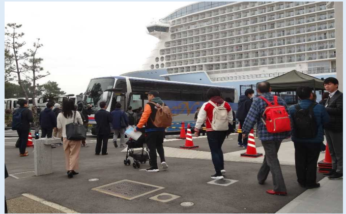
シャトルバスに乗り込む利用客 (マリンポートかごしま)