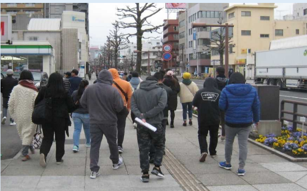
市中心部へ向かうシャトルバス利用客