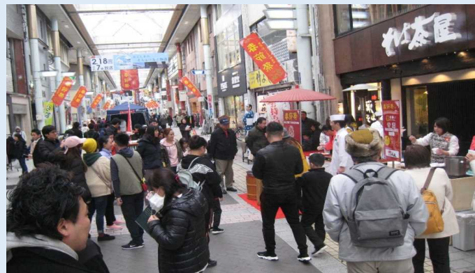
天文館を訪れたシャトルバス利用客