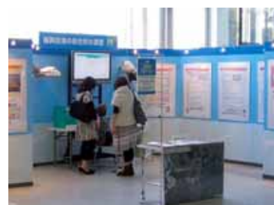
インフォメーションコーナー(福岡空港)の様子

事前にお申し込みいただいた市民等のみなさんや懇談会に参加いただいた方のうち希望された方を中心に、一般入場者も含め公開で意見交換会を行う催しです。平成20年11月4日福岡市天神にて開催し、100名を超える参加者のなか様々な意見が出されました。