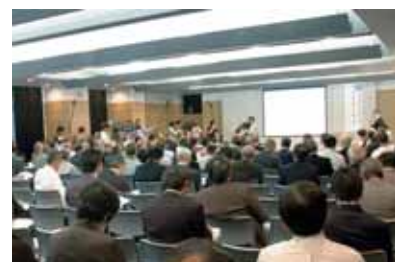
市民意見交換会(福岡市)の様子