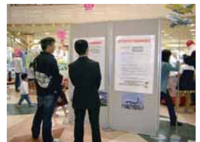
ゆめタウン久留米(筑後地区)でのオープンハウスの様子

福岡空港調査PI有識者委員会によるステップ4のPI活動に関する状況把握等については、PI活動期間を通じて実施され、その都度評価や助言がなされます。