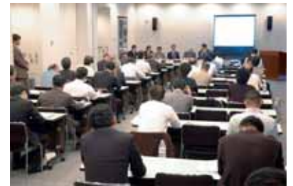
北九州国際会議場(北九州市)での説明会の様子