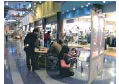
ショッピングモールマリナタウン(福岡市内)でのオープンハウスの様子