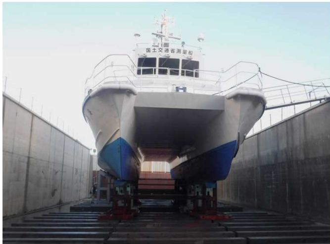
⑥ 船が安定して架台に支えられるのを確認しながら 排水 します。排水が終われば 完了 です。