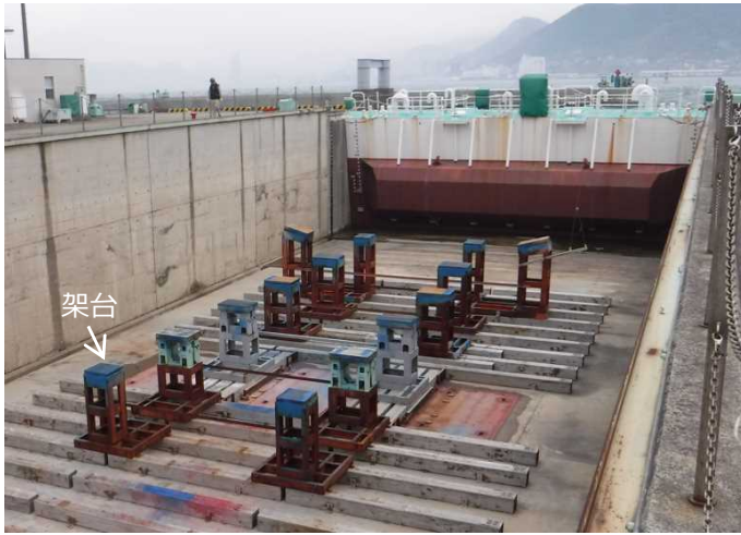
① ドライドックに船を入れる前に、船を支えるための 架台を配置 します。