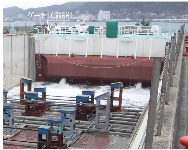
② ドックゲート (扉船) の通水口からドライドック内に海水を 注水 します。