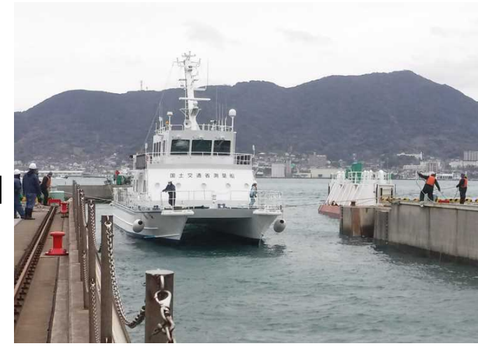
④ ドライドックまで 船を移動し 誘導します。