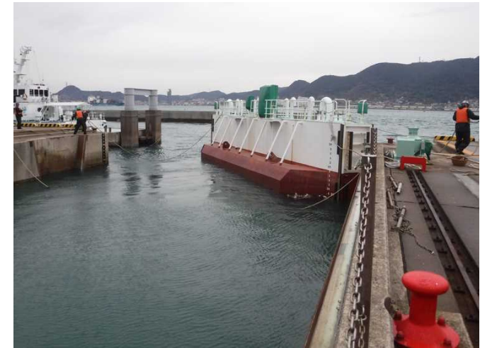
③ 海面と同じ高さまで注水できたら、 ゲートを浮上してロープで移動 させます。