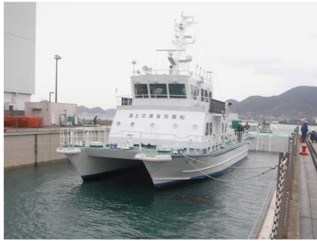
⑤ 船を架台の上まで誘導できたら、 ドックゲートを閉じてポンプで排水 します。