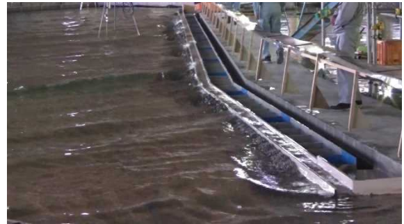
平面水槽における実験イメージ