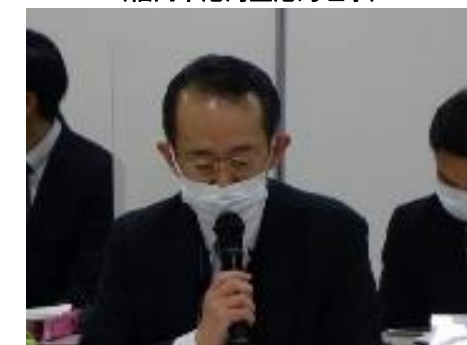
CNPに関する最近の動向についての説明 (博多港湾・空港整備事務所長)