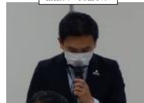
開会挨拶 (福岡市港湾空港局理事)