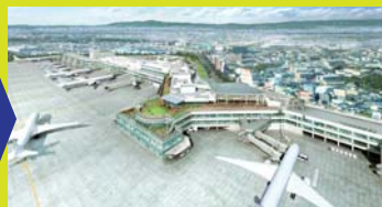
国内線旅客ターミナルビル完成イメージ