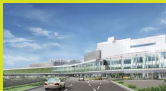
一体化されたターミナルビル