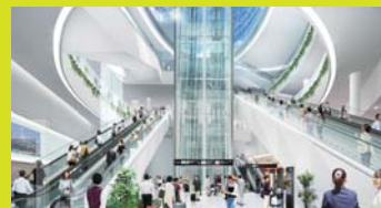
新地下鉄フロアからの吹き抜け