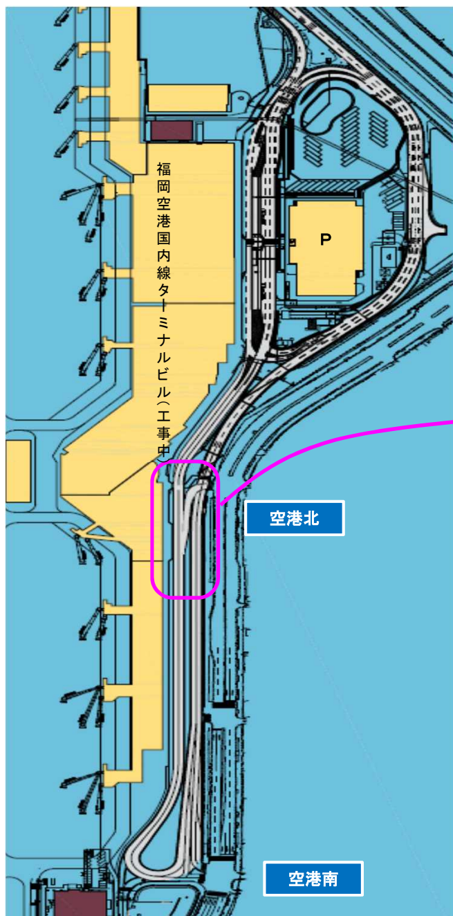
福岡空港 道路全体図