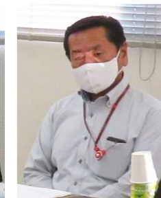
三池貿易振興会 津川専務理事