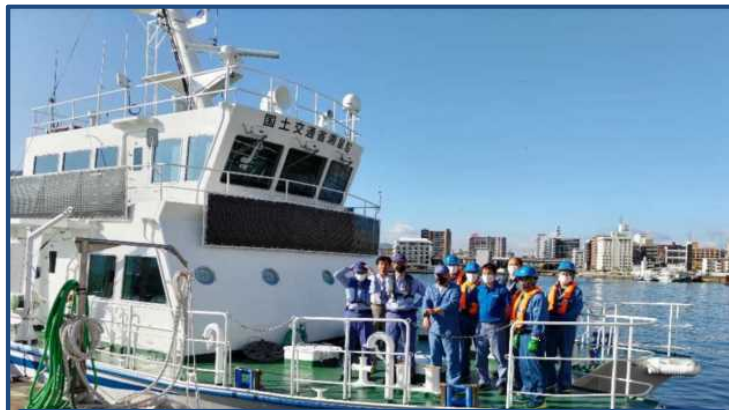
関門航路事務所 測量船「海燕」 北九州港を出港

調査の結果、8月4日（木）18時に航泊禁止が全て解除され、徳山西航路の航行が可能になるなど港湾機能の一部が回復しました。