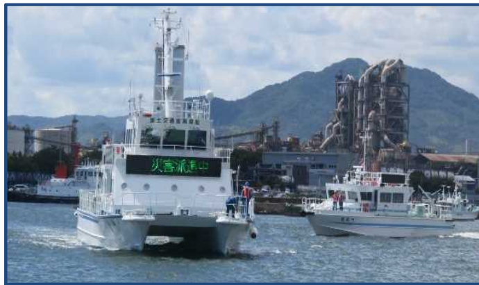
中国地整所属の「たましおII・おおつ」と調査中の「海燕」