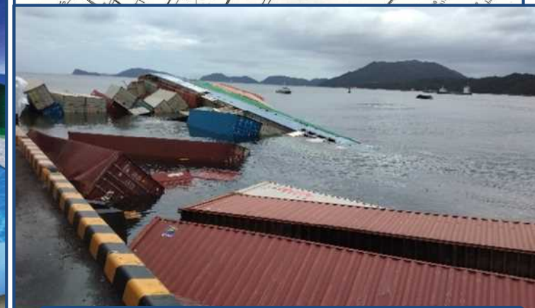
散乱したコンテナ