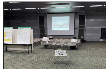
商工貿易会館 (福岡県北九州市)