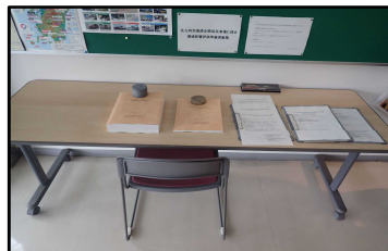
国土交通省九州地方整備局 苅田港湾事務所