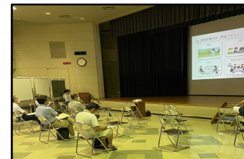
小波瀬コミュニティセンター (福岡県京都郡苅田町) 2