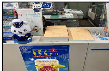
北九州市役所 (空港企画課執務室内)