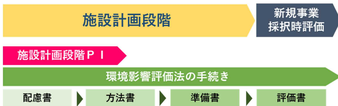
図1 北九州空港滑走路延長計画の手続き

滑走路延長計画は、一般空港の整備指針（案）に基づくP Iガイドライン（案）において、施設計画段階P Iの実施が求められています。このP Iは、事業採択を判断する新規事業採択時評価に先行する施設計画段階において行うものであり、滑走路延長の必要性や妥当性等に関して、みなさまからのご意見を把握するために実施するものです。