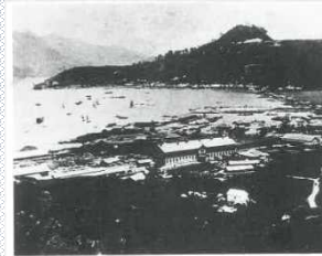
門司港全景(明治20年代後半頃)