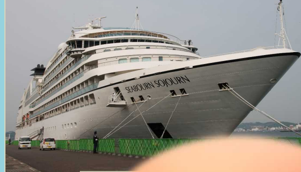
西海岸地区に初入港した「シーボーン・ソジャーン」 令和元年5月13日撮影