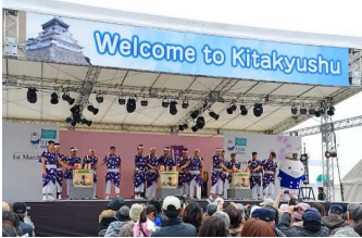
歓迎イベントの様子

平成31年3月1日(金)、北九州港開港130周年の一環として、ひびきコンテナターミナルに「クイーン・メリー2」が寄港しました。「クイーン・メリー2」は、設立170年以上の歴史を持つ老舗の英国船社「キューナード・ライン」が運航する豪華客船。「キューナード・ライン」は、「クイーン・メリー2」「クイーン・エリザベス」「クイーン・ヴィクトリア」の女王の名を冠した3隻を運航しており、その中でも「クイーン・メリー2」は最大の規模を有するフラッグシップです。当日は歓迎イベントなどが行われ、約13万人の市民が訪れました。