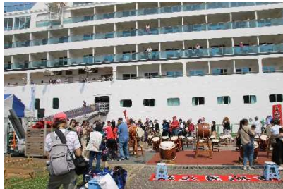
クルーズ船歓迎イベントの様子

北九州市の主要観光地である門司港レトロ地区から徒歩圏内の西海岸地区に位置する桟橋式の岸壁であり、主にクルーズ船の着岸に利用されています。岸壁背後では様々なイベント等が開催され、国内外から多くの観光客が訪れています。