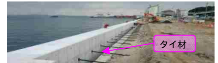
上部コンクリート施工状況