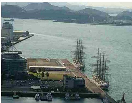
西海岸に停泊する日本丸(手前)と海王丸

14 年ぶりとなる 2 隻同時公開となり、船内の一般公開や約 100 人の実習生によるセイルドリル（操帆訓練）が実施され、1 万人超の多くの市民で賑わいました。