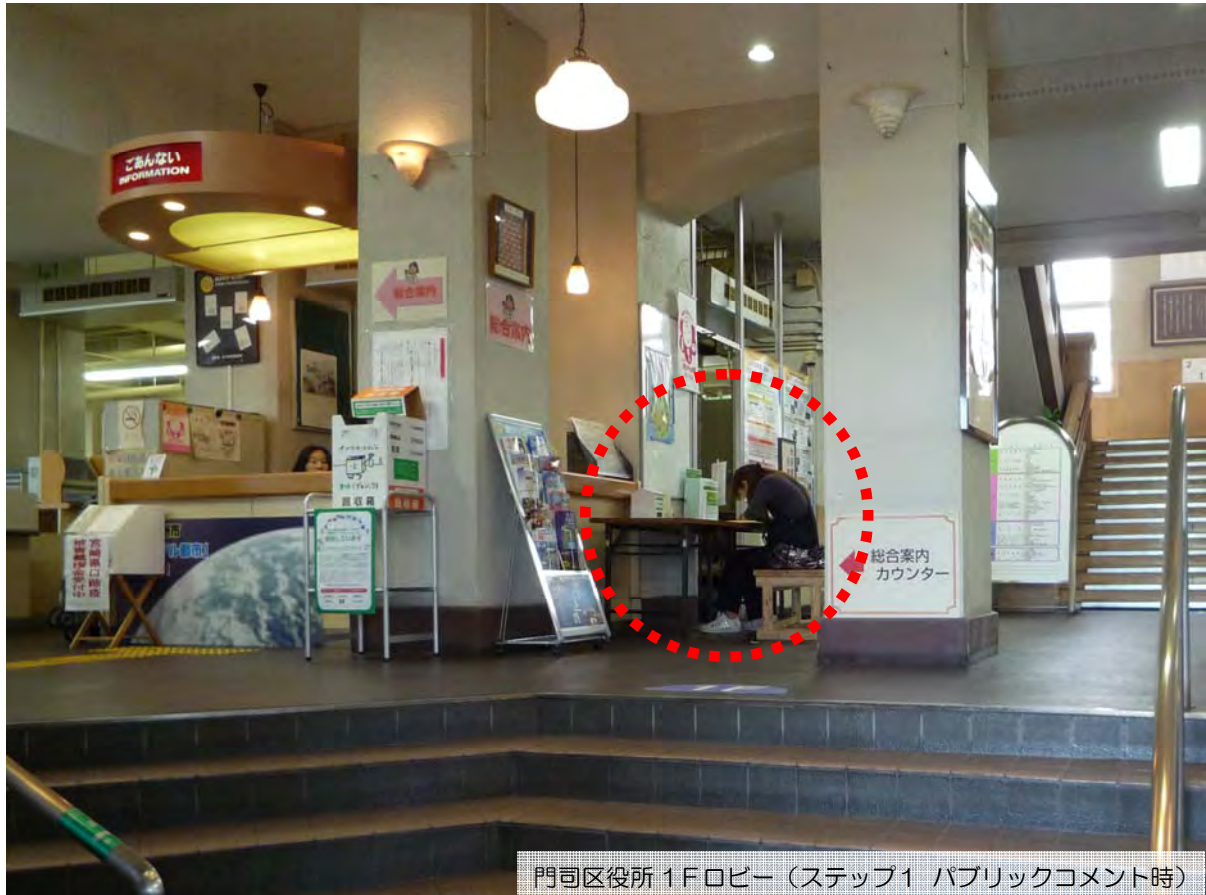
門司区役所 1Fロビー（ステップ1 パブリックコメント時）